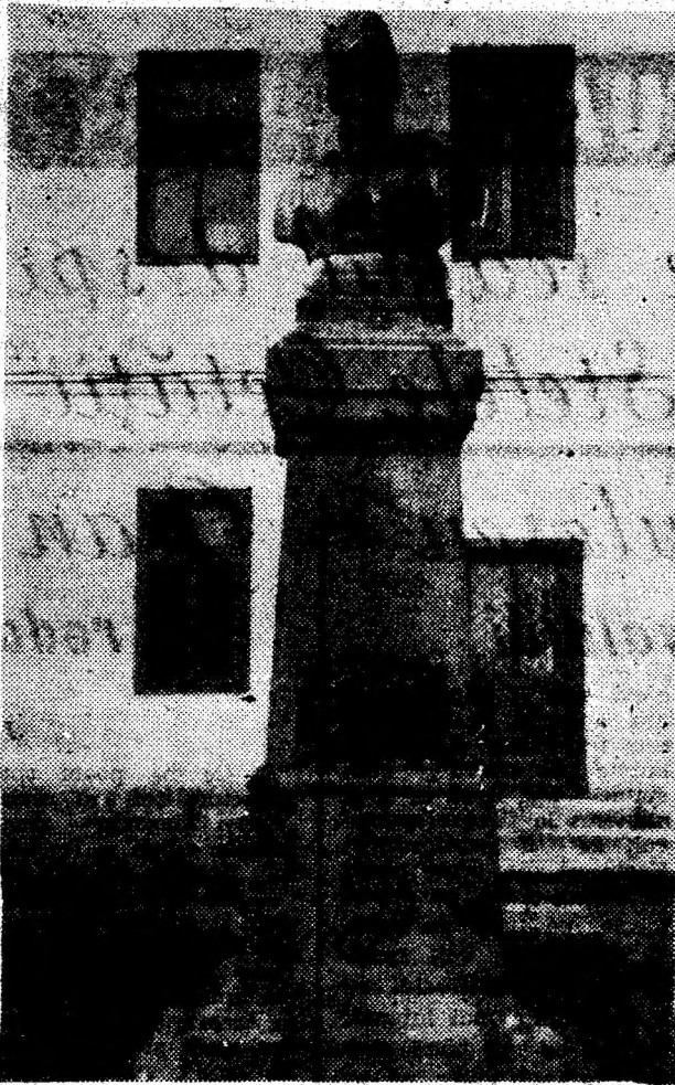
Statuia lui Avram Iancu din Baia de Criș.