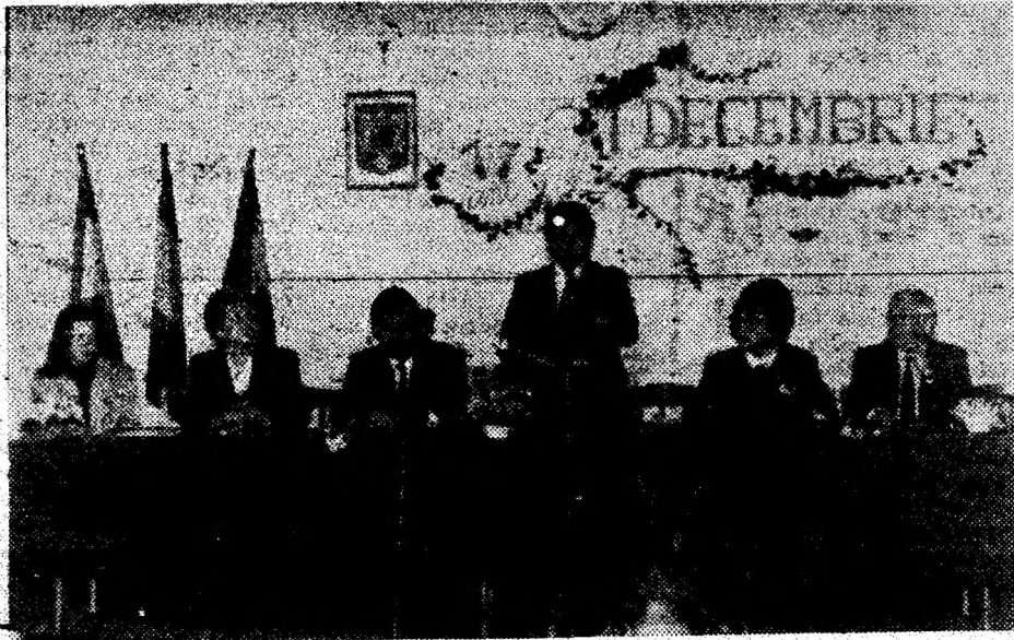
Moment al festivității prilejuite de adoptarea noii denumiri a Grupului Scolar de Transporturi și Telecomunicații „Transilvania” Deva.