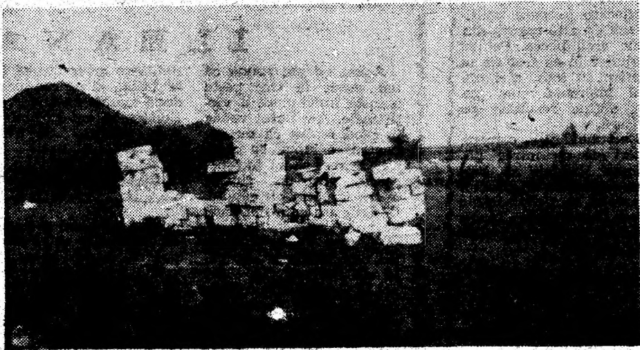
Lată ce a mai rămas din 40 mc de b.c.a. după ce fiecare a luat cât a putut atunci când nu l-a văzut nimeni. Păcat! Era plătit din banii sătenilor din Brotuna pentru a-și face căminul lor cultural.

— Cu sobe sau cu ce pot. Centrala termică a vândut-o RAGCL Brad, iar