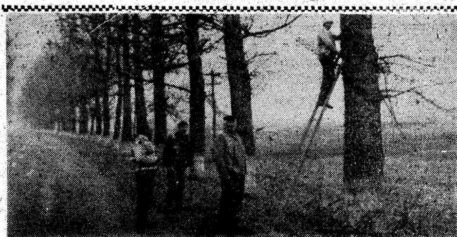
Imaginea de față, receptată marți, 28 noiembrie, în jurul orei 11, pe șoseaua Brad — Oradea — la Ociu — reproduce în linii mari cam ce se întâmplă în societatea românească actuală: unul muncește și trei îl asistă.