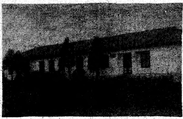
Școala din Mintia a fost recent renovată.

să existe cabinet medical, farmacie cu toate medicamentele din rețea, inclusiv cele cu preț compensat; • acordarea de către pensionari calificați a asistenței juridice gratuite pentru soluționarea unor probleme privind drepturile prevăzute de lege; • funcționarea, în sediul partidului, a unui birou cu no-