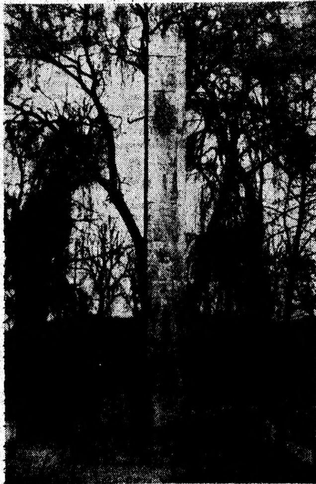
Complexul statuar „Avram Iancu” din Baia de Criș.