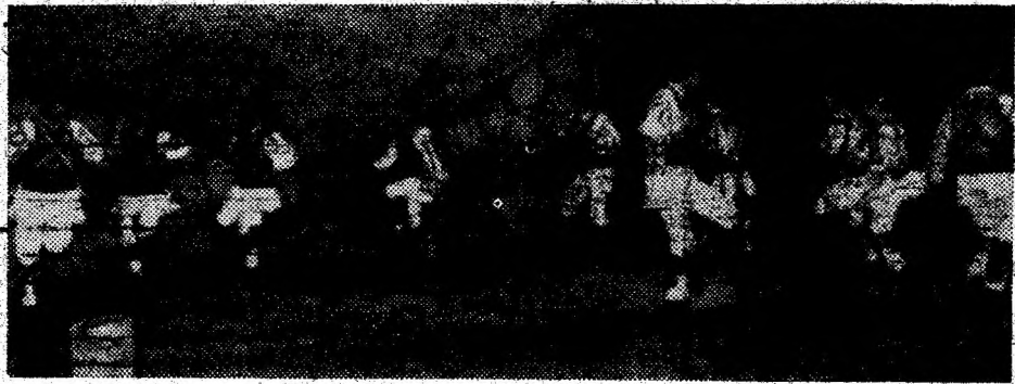
Călușerii din Boșorod.