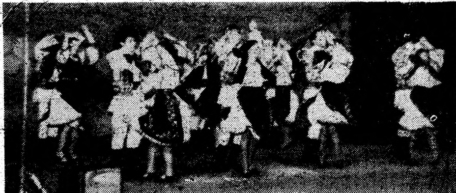
Ansambliul folcloric „Pădureanca” al Casei de cultură Hunedoara.