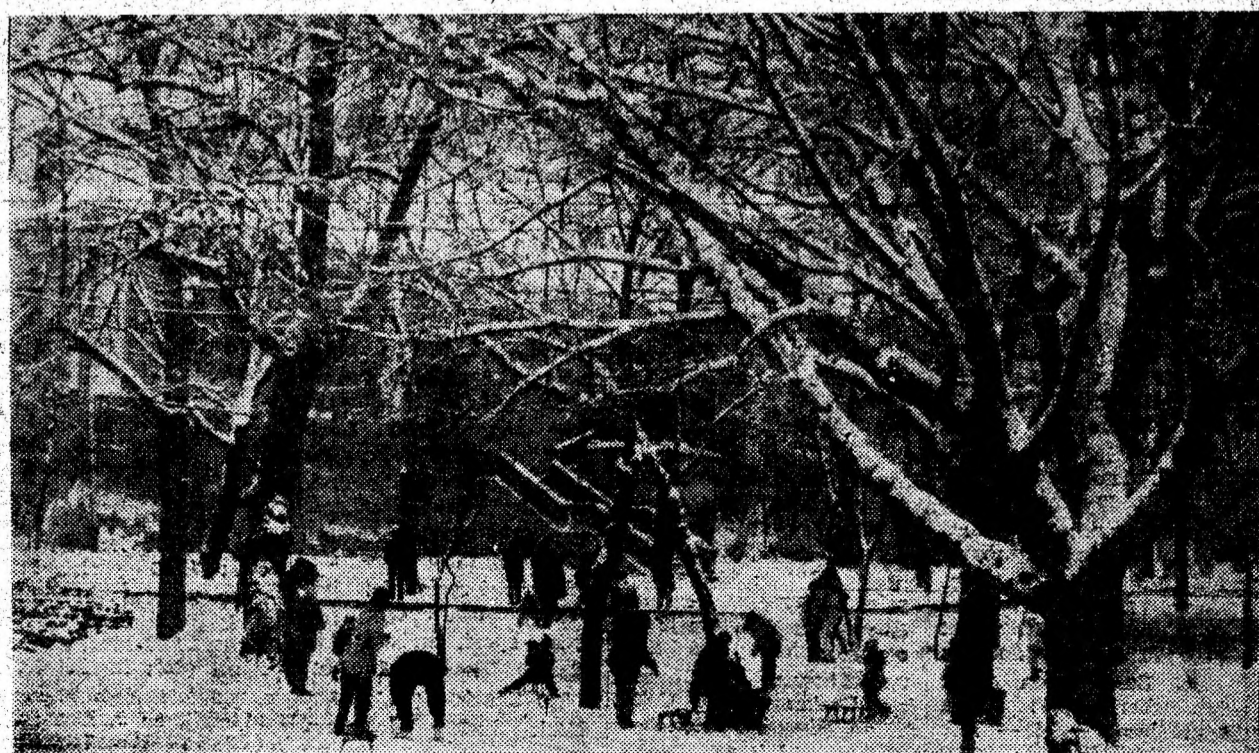
Bucurie mare! Copii la săniș în parcul orașului Deva.

Cursuri de referință ale Băncii Naționale a României.