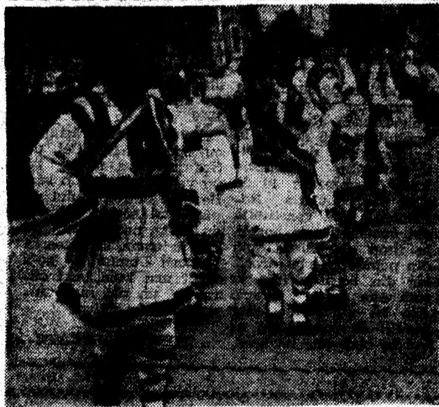
„Am plecat la colindat“.