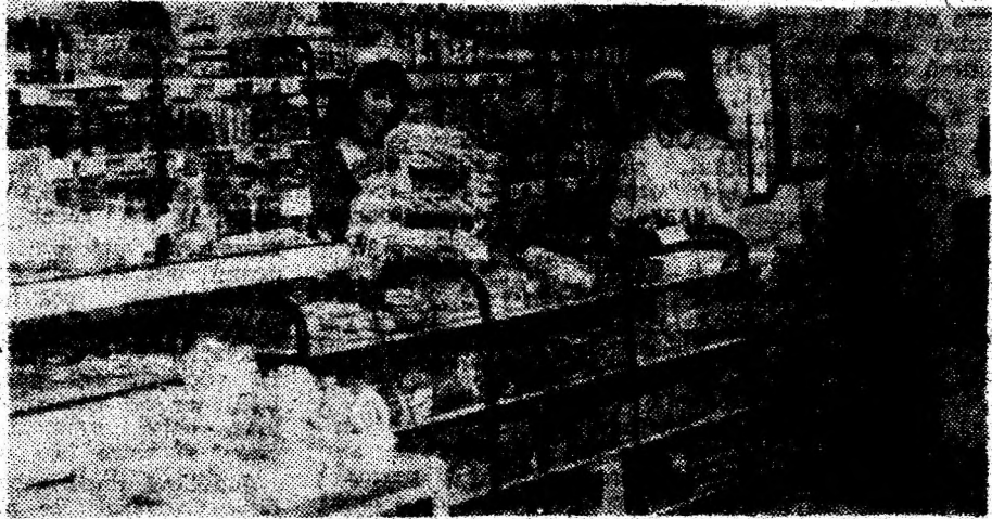
Magazinul alimentar — abundent aprovizionat cu marfă — vă așteaptă.

Dacă bunul Dumnezeu ne ajută, așa vor deveni și magazinul din municipiul Brad, și cel din orașul Hateg, pe care îl vom deschide nu peste mult timp. În zilele următoare vom da drumul unui punct de desfășurare pentru pâine, produse de panificație și alte mărfuri alimentare pe strada Minerului, din Deva, în zona liceelor. Și tot cu vrerea Domnului, vom organiza în acest an o secție complexă de specialități de panificație, iar din primăvară vom pune la dispoziția clienților terasa și barul de la ultimul etaj al sediului societății. Ne vom mobiliza și noi mai mult, sperăm să ne poată ajuta mai consistent și banca, pentru că munca și rezultatele noastre sunt în continuă îmbunătățire și diversificare. Clienții pot miza pe seriozitatea noastră, pe produsele noastre, pot avea încredere în noi. N-o să-i dezamăgim. (R. P.)