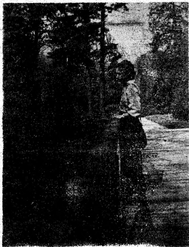
Pădurea — izvor nese cat de frumoșe.

După Zodiacul chinezesc, anul 1996 este anul Șobolanului și se prevede a fi un an al belșugului, plin de ocazii favorabile. Afacerile vor cunoaște o amplitudine maximă, bogățiile se vor acumula, averile se vor face ușor. Este un an pentru investiții pe termen lung și care ne vor folosi în anii sterili ce vor urma. Orice aventură începută va fi plină de succes. Dar nu riscați dacă nu e nevoie; anul este dominat totuși de răceala ierbei și întinericul nopții. Cei care se vor a-runca orbește în afaceri vor cunoaște și fața tristă a monedei. Va fi un an liniștit, dar și cu ciorovăială și mici discuții care vor aduce unele necazuri. An be- vor folosi în anii sterili ce vor urma. Orice a- într-un dialog aprins, bu- ventură începută va fi curându-ne de realiză- rile noastre.