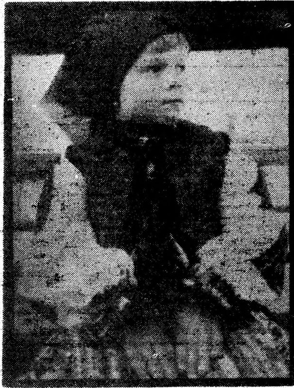
Fată de la Feregi.