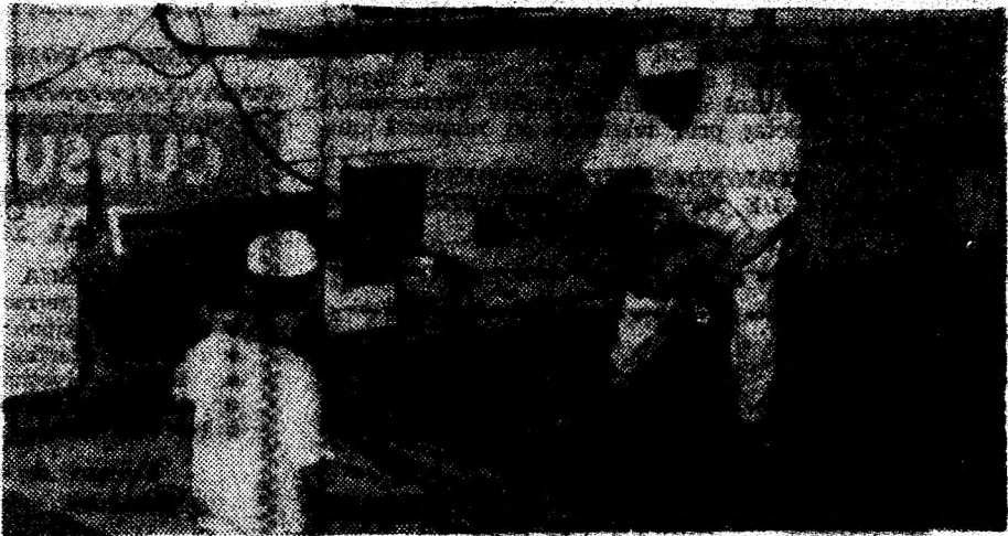
O nouă parjă de pâine pornește spre mesele consumatorilor.