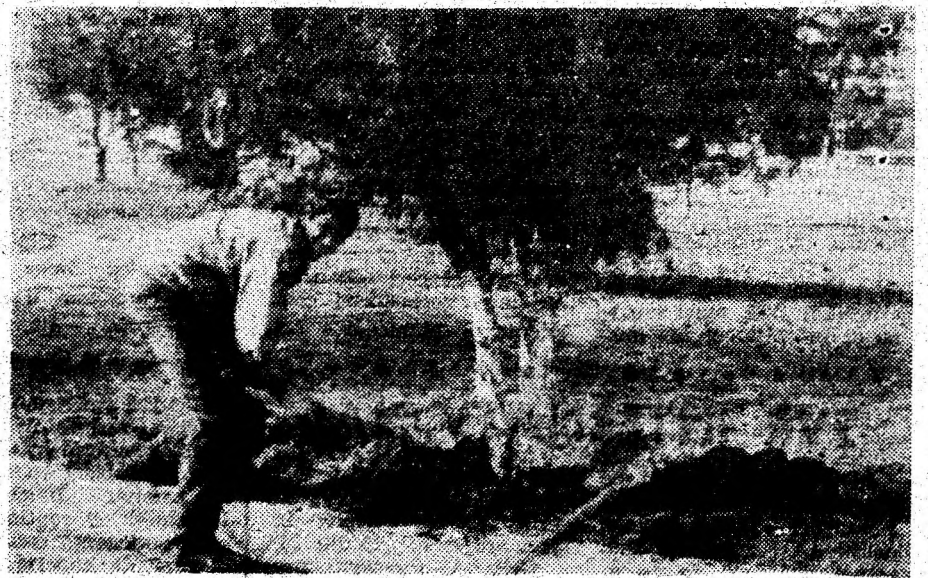
La Vața de Jos se sapă gropile pentru împrejmuirea parcului din centrul localității.