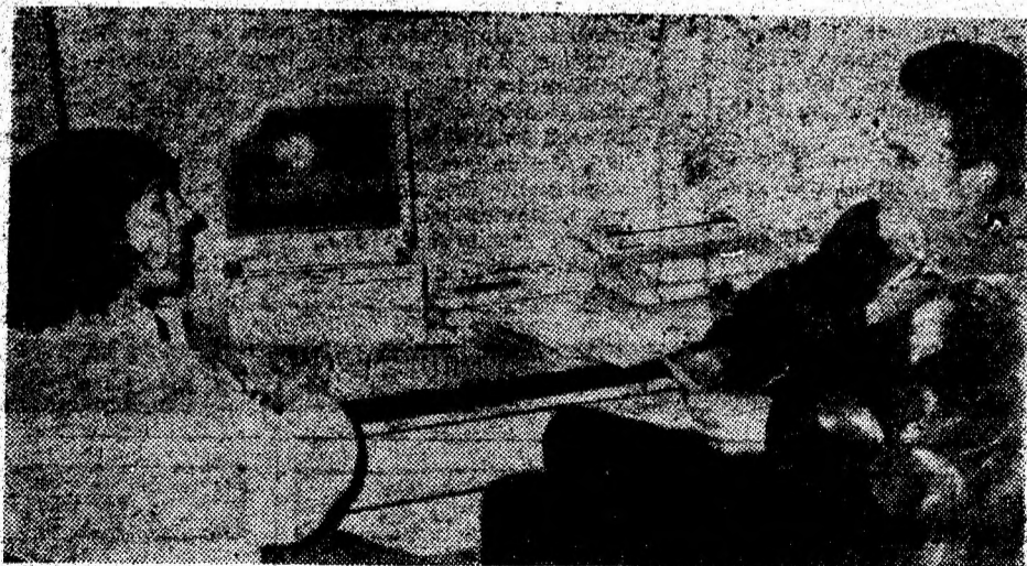
Recent inauguratul Centru de forță de muncă și șomaj din orașul Simeria oferă servicii de calitate.

Conducerea PDSR a stabilit că este necesară o campanie mult mai susținută împotriva partidelor de stânga, afirmă un membru marcant al conducerii PDSR. Pentru că din 1992 PDSR a fost sprijinit de formațiunile de stânga, ofensiva electorală a acestora „a surprins partidul de guvernământ cu garda jos pe stânga”. De aceea, viitoarea campanie electorală va pune accent și pe programul socialiştilor, pe care îl vom cataloga ca „nostałgici comunisti” și „restauratori ai dictaturii comuniste”, a mai precizat surse citată. O altă modalitate va fi escaladarea conflictului PS — PSM, precum și cea a promisiunilor identice, care să deçoace orice tentativă de alianță.