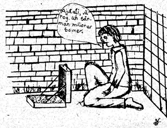
Desen de LAVINIA BĂTESCU, Deva.

dițiile specifice județului nostru, există un volum apreciabil de lucrări ce trebuie executate în privința combaterii eroziunii solului, desecărilor, irigațiilor și construcțiilor hi-