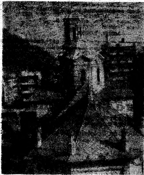
Catedrala „Sf. Nicolae” din Deva, văzută de sus.