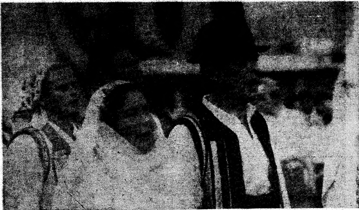
Români basarabeni, într-o paradă a portului și cântecului popular românesc.