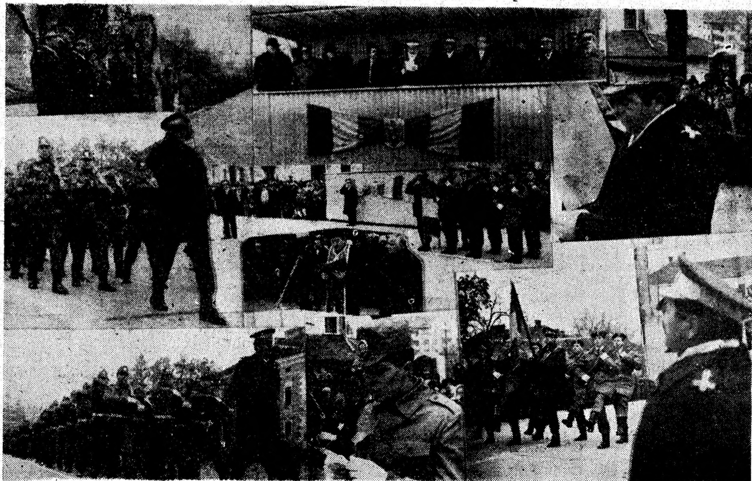
Imagini din activitatea Batalionului de jandarmi al județului Hunedoara.

Pagină realizată de VALENTIN NEAGU, CORNEL POENAR