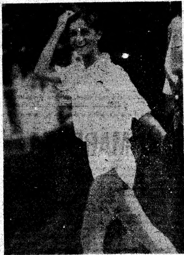
O fată fericită.