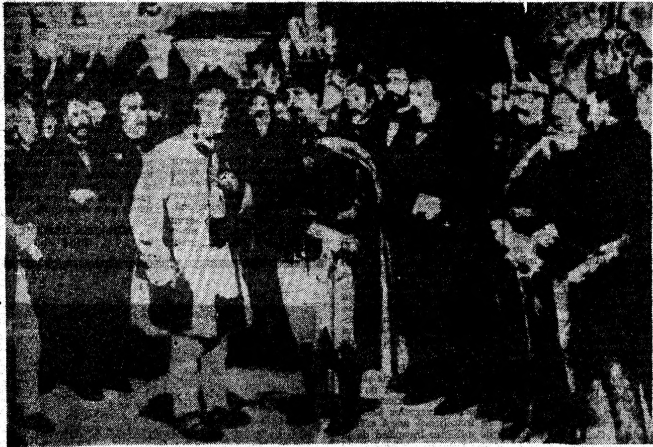
Alexandru Ioan Cuza, primul domnitor al Principatelor Unite, în mijlocul poporului