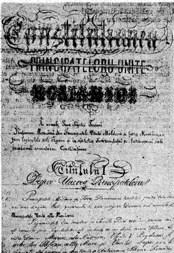
Constituția Principatelor Unite (facsimil).

transilvăneni, transilvănenii sunt moldoveni și munteni, iată singurul aspect adevărat și posibil al acestui majestuos tablou, de o unitate națională fără exemplu în analele lumii”. Ei au relevat, ca să cităm după Hașdeu, că: „Moldova, Transilvania și Muntenia nu există pe fața pământului, există o singură Românie cu un picior în Dunăre și cu altul pe ramificațiile cele mai depărtate ale Carpaților, există un singur corp și un singur suflet, în care toți nervii și toate suspinele vibrează unul către altul...”