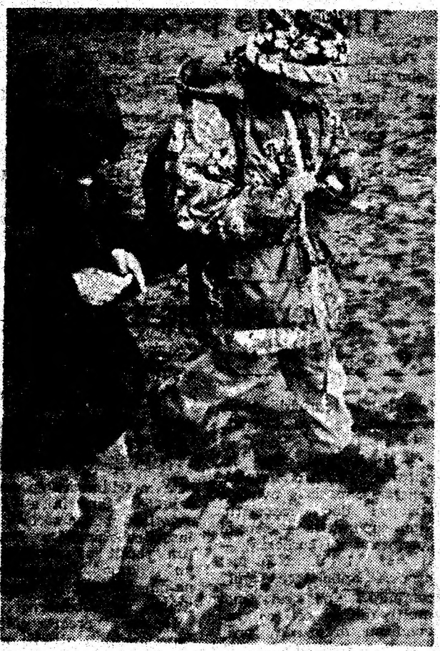
Din fragedă pruncie, cu gândul la economie de piață...

Anul VIII • Nr. 1558 • Joi, 25 ianuarie 1996 • 4 pagini • 200 lei