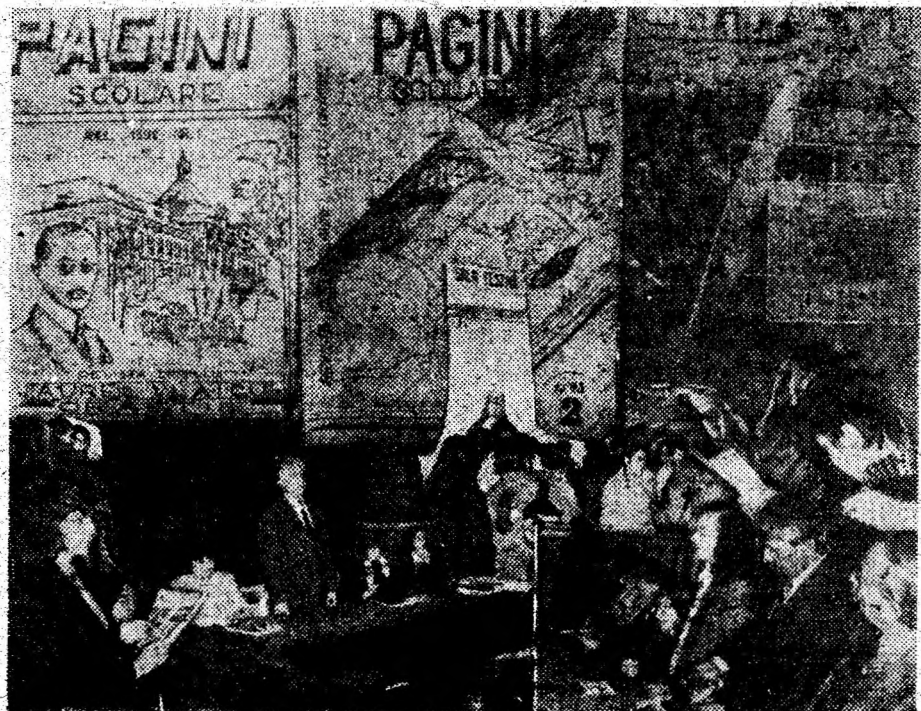
Revista „Măiastra” — continuatoarea „Paginilor școlare” — publicație a elevilor și profesorilor de la Liceul Teoretic „Aurel Vlaicu” din Orăștie. Fotomontaj: SANDU CAZAN.