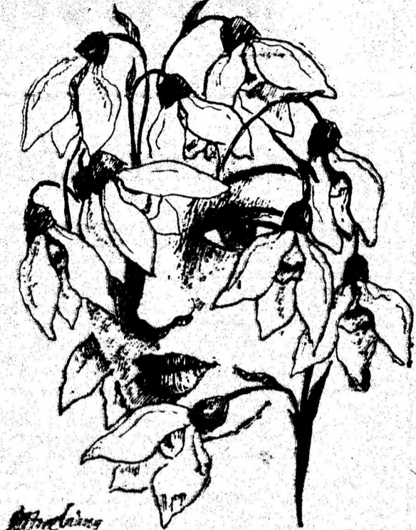
Și, totuși, ghiocii sunt pe aproape! Desena de DORINA ITUȘ CRÎNG.

În ultima vreme, oamenii au început să discute asupra a două aspecte care îi interesează în cea mai mare măsură pe mulți dintre ei. Primul dintre acestea este realizarea unei pasarele peste Mureș, între