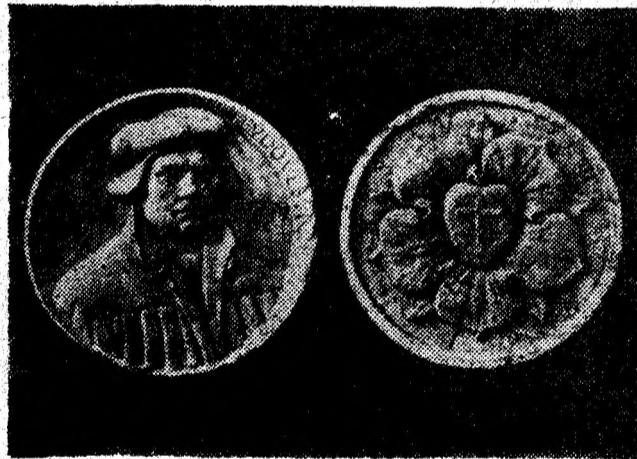
Basoreliefuluri de la muzeul reformei din orașul lui Luther, Wittenberg. (Germania).

• Cel mai bun mijloc de a te descotorisi de un dușman e să-l vorbești peste tot de bine.