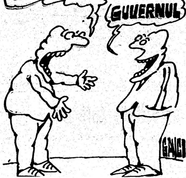
Desen de CONSTANTIN GAVRILĂ

AM SIMȚIT CĂ CINEVA MI UMBLĂ ÎN BUZUNAR. AM ACȚIONAT RAPID, PRINZÂNDU-L DE MÂNĂ ȘI... GHICI CINE ERA?