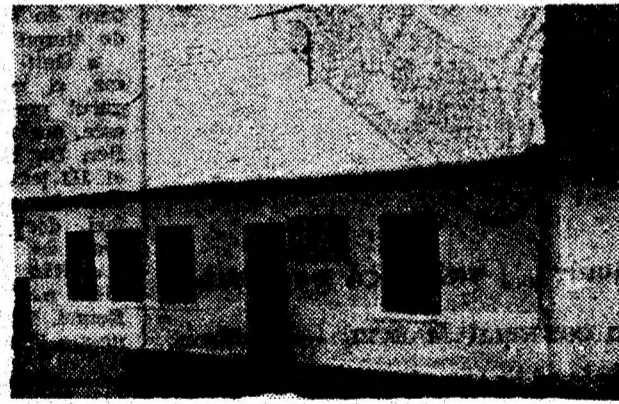
Școala Primară din Dăbica și noua sa înfățișare după reparații.