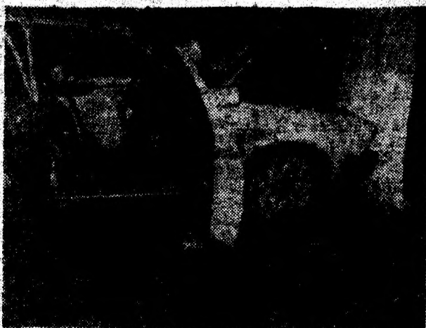
Una din consecințele impactului dintre autovehiculele angajate în accident.