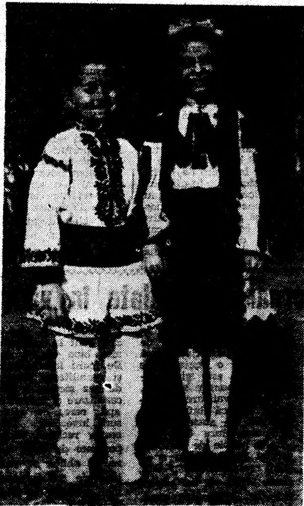
Costumul popular, purtat și prețuit din copilărie.