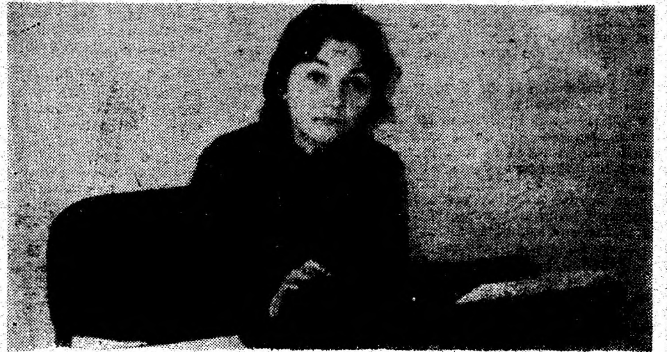
Tănăra din imagine lucrează la Centrul de calificare, recalificare și perfecționare a șomerilor Deva, din cadrul Direcției Muncii și Protecției Sociale Hunedoara — Deva.