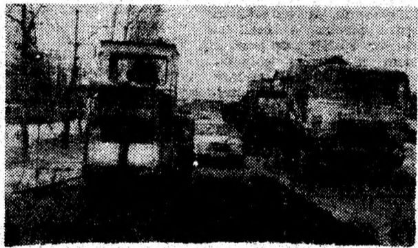
...Și pe străzile reșede din județul Deva, gropile încep să se acopere...