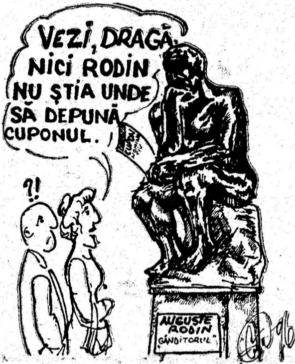
Desen de CLAUDIU COTA