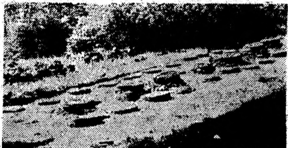
Sanctuarul mare de calcar de la Sarmizegetusa Regia (Munții Orăștiei).

La consătuire participă reprezentanți ai Ministerului Lucrărilor Publice și Amenajării Teritoriului, Ministerului Culturii, Ministerului Învățământului, Ministerului Tineretului și Sportului, Prodomus, Urbanproiect, Universității și Muzeului Național de Istorie a Transilvaniei din Cluj-Napoca, Institutului de Arheologie din București ș.a. Din județ participă conducători de instituții județene, arhitectul șef al județului, directori de societăți comerciale, regii autonome, bănci, reprezentanți ai primăriilor din Orăștie, Orăștioara de Sus, Beriu, Boșorod ș.a.