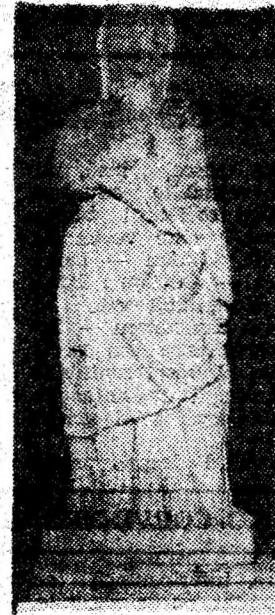
Matroana romană de la Sarmizegetusa.

● Cetatea dacică de la Piatra Roșie — Lunca era construită din piatră. Forma generală a incintei este patrulateră, are cinci turnuri. Așezată pe culmea unui deal izolat, cu prăpăstii abrupte, fa. ce parte din sistemul de fortificații ce aveau rolul să apere de o eventuală apropiere dinspre vest și sud-vest a inamicului care ar fi încercat să atace Sarmizegetusa de la Grădiștea Muncelului, capitala Daciei libere.