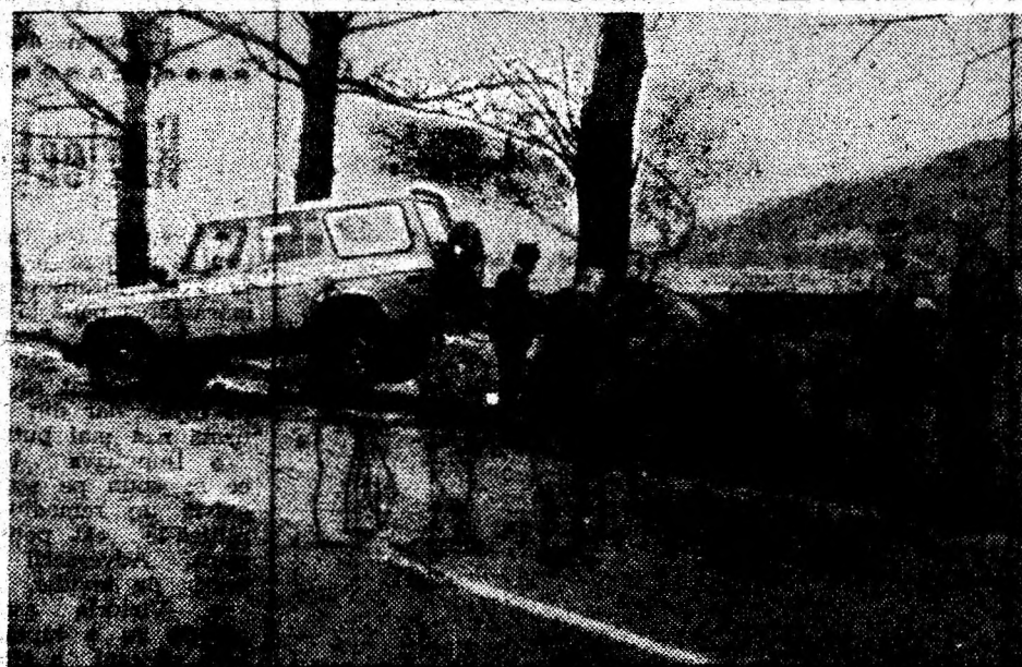
Stau la margine de drum pomul rău și omul bun.

important în viața economică a țării; • P.S. nu este împotriva integrării țării în structurile europene, însă pentru intrarea în NATO ar fi bine să se organizeze un referendum național; • în alegerile locale Partidul Socialist va merge cu liste proprii de candidați, în cele generale și prezidențiale ar fi posibil să realizeze alianțe.