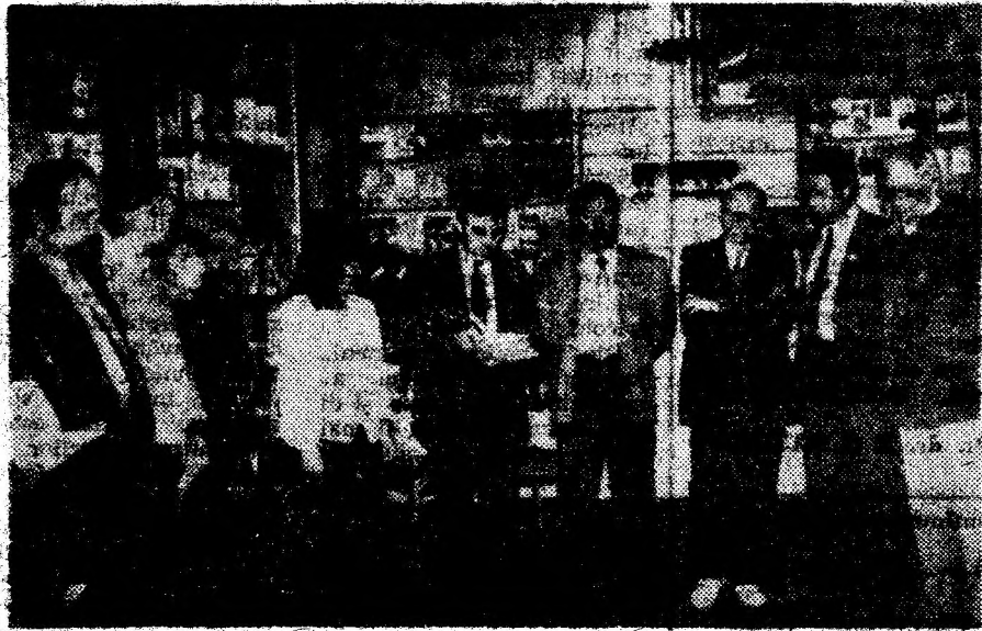
Aspect din timpul prezentării și lansării celor 4 volume de versuri la Casa Cărții din Deva.