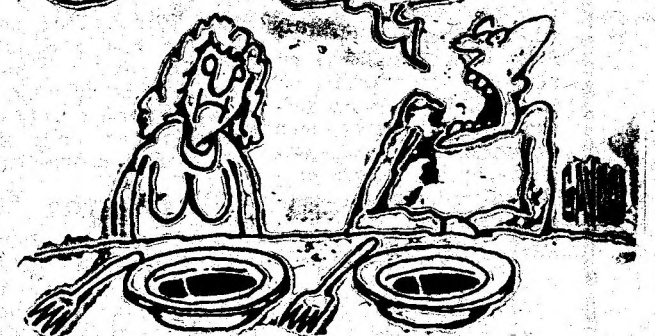
Desen de C-TIN GAVRILA

NU MI-AR DERANJA CĂ GUVERNUL CALCĂ ÎN STRĂCHINI, DACĂ AR CALCA ÎNTR-ALE LUI, NU ÎNTR-ALE NOASTRE.