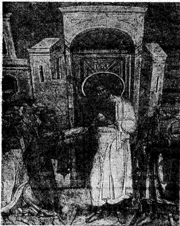
Frescă aflată în Mănăstirea Cozia

Ce se întâmplă însă în trecut, înainte de inventarea suprafețelor de reflexie? Pe atunci în marile cinematografe ale lumii se utiliza o tehnică specială: ecranul era stropit frecvent cu apă, suprafața sa lucioasă reflectând suficient de bine lumina proiectată. (I.L.)