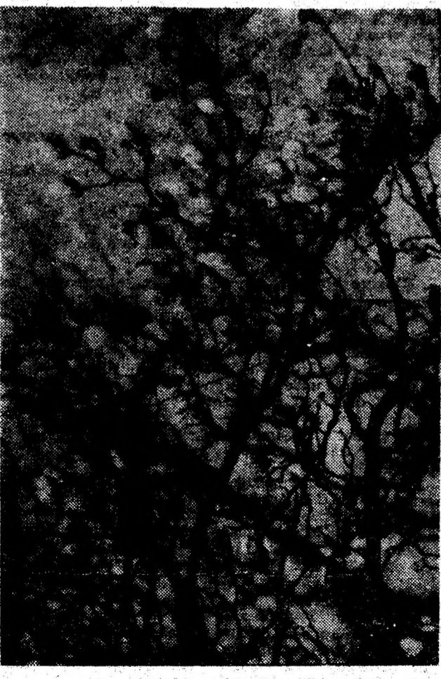
Au înflorit magnoliile în Parcul dendrologic din Simeria.

• CORVINUL, ACASA. Și în această etapă (a 28-a) Corvinul Hunedoara are meci tot pe teren propriu, cu C.S.M. Reșița, întâlnire între două cunoscute com-batante din fotbalul românesc. Sperăm să fie un meci viu disputat cu învingători hunedoreni.