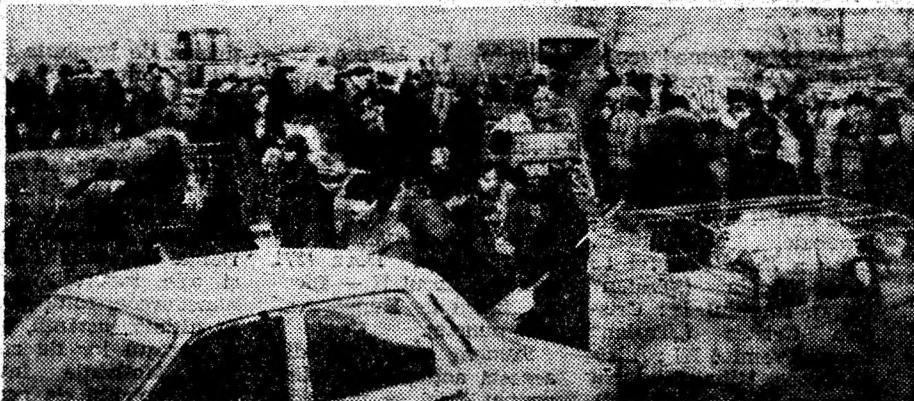
Oamenii din comuna Lăpugiu de Jos sunt vrednici lucrători ai pământului și pricepuți crescători de animale. Un loc unde își valorifică produsele agricole ce le prisosesc în gospodării și de unde și procură cele necesare traiului este și fărul ce se organizează periodic în Dobra, comuna cu care se învecinează.

„Poarta” de la intrare în județul nostru de la Lăpugiu de Jos face o bună impresie celor ce vin în județul nostru de la Timișoara sau de mai departe.