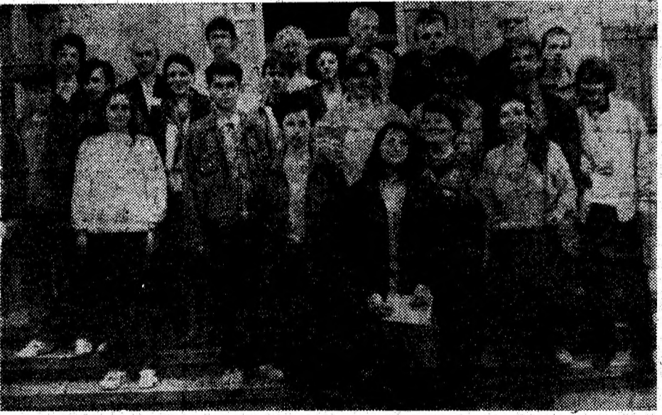
Elevi premiați și profesorii lor, participanți la ediția a II-a a concursului bianual „Olimpiada inteligenței”, desfășurat la Liceul Teoretic „Iancu de Hunedoara”.

Concursul „Olimpiada inteligenței” a prezintă interes în rândul elevilor, îi ține pe aceștia într-o activitate permanentă, fiindu-le stimulată preocuparea de-a lungul întregului an școlar. Să reamintim că este vorba de elevii claselor a X-a și a XI-a care nu vin după un examen de admitere, nici nu se pregătesc pentru bacalaureat, fapt ce poate conduce la o stare de apatie. Se conturează astfel o motivație a învățării și spiritului de competiție solicitate și de reforma învățământului românesc. Nu e vorba nicicum de competiție între două instituții școlare, nici nu se urmărește afirmarea unor cadre didactice, ci pur și simplu stimularea elevilor în procesul de învățare, conturarea unui schimb de experiență benefic la nivelul celor două catedre.