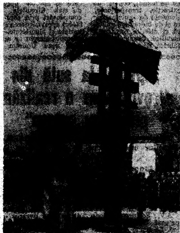
Troița înălțată de ostașii români la Pavlinka (fosta B.R.S.S.).

În memoria celor căzuți pe câmpul de luptă pentru țară, la cimitirul eroilor din Deva, precum și la monumentele și troițele ridicate în întregul județ, vor fi depuse azi, 9 mai a.c., coroane și jerbe de flori, vor fi săvârșite slujbe de pomenire. Florile recunoștinței veșnice, florile care amintesc de vitejia, dăruirea și sacrificiul întregului popor român. (M.B.)