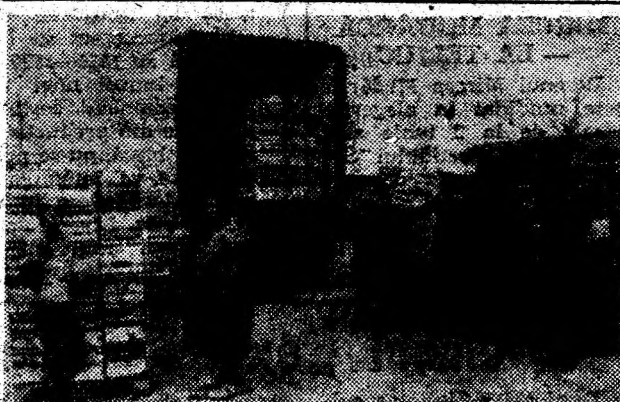
Din serele S.C. „Sansere“ Sintândrei s-au recoltat, încărcat și expediat primele cantități de varză la export din acest an.