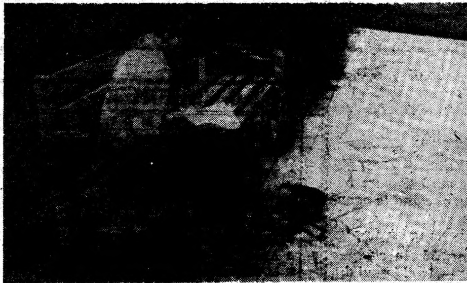
Ce poate fi mai plăcut decât să citești în parcul însorit?