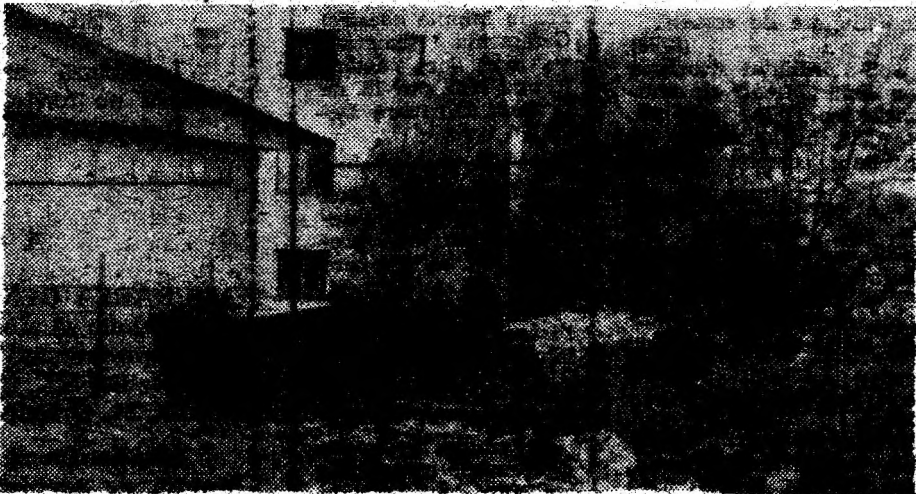
Privescătoarea... respingătoare în zona „Orizont”.