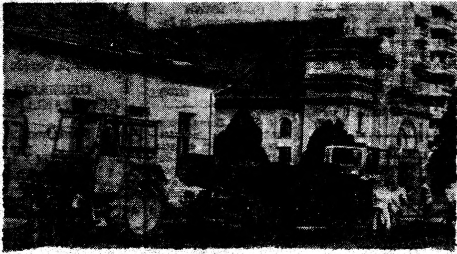
Pe bdul 22 Decembrie se plombează gropile în ritm alert. Se apropie alegerile locale...