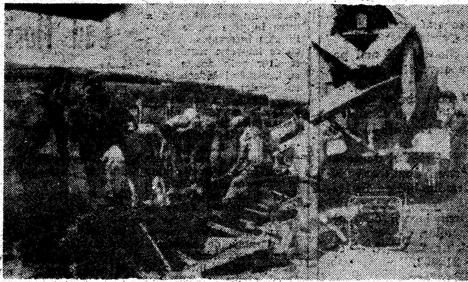
Lucrările de reabilitare a D.N. 7 pe traseul Deva — Sebeș. Aspect de la consolidarea zidului de sprijin pe traseul Sîntuhalim — Simeria.

Cursuri de referință ale Băncii Naționale a României