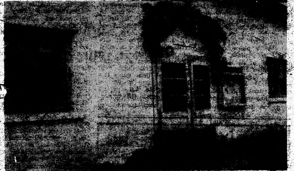
Căminul cultural Băz. O ușă scorojită, cu geamuri sparte și „incuiată” cu o bucată de sarmă...

La Consiliul local Călan, dl primar Mihai Negescu susține că s-a acordat prioritate reparațiilor instituțiilor de învățământ și sănătate, „care au o funcționalitate mai mare”. Dar anul acesta vor fi reparate toate căminele, dacă ajung fondurile. Deocamdată există devizul pentru, cel din Valea Singiorgiului (despre care am aflat că nu mai are nici