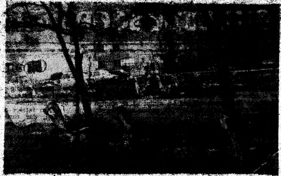
Așa arată un spațiu de joacă și odihnă din centrul Deva (în spatele ASIROM)