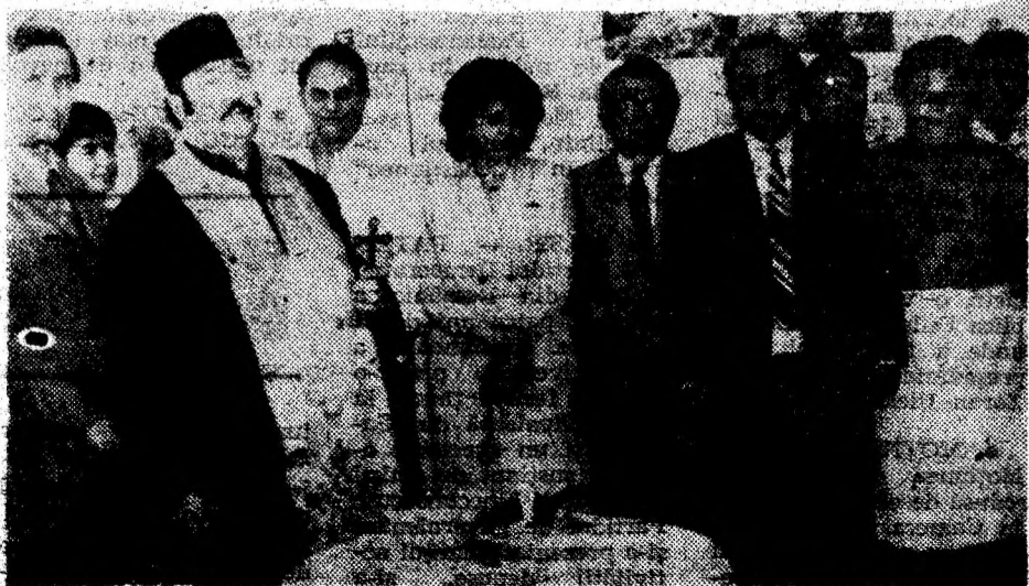
Aspect de la momentul inaugurării Dispensarului medical din Șoimuș.