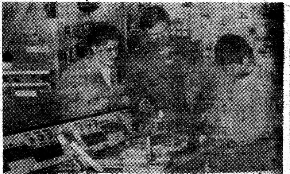
Teoria ca teoria, da' practica ne omoară.