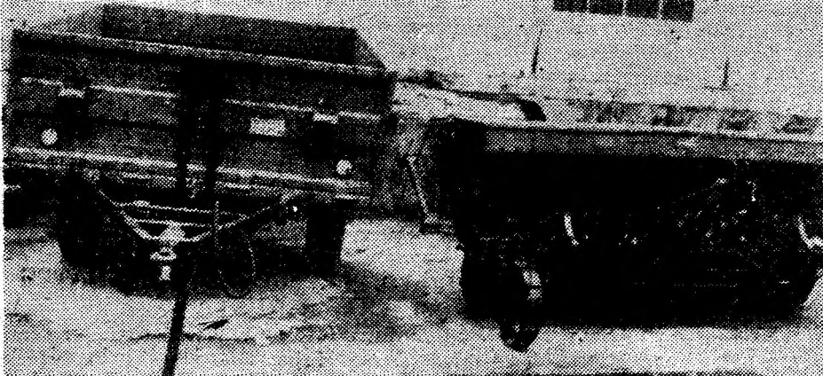
S.C. Aprotera Simeria. Un nou lot de utilaje aduse la solicitarea producătorilor agricoli.