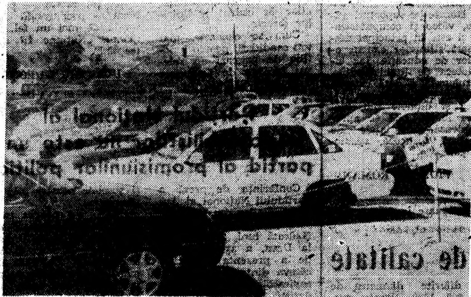
Bani să fie, deoarece în parcul de la „Dacia Service” Deva se găsesc suficiente mașini pentru vânzare.

Mulțumim foarte mult beneficiarilor apei potabile din Deva și împrejurimi, pentru înțelegere, ne cerem scuze celor care au suferit în zilele de 16 și 17 mai din cauza lipsei de apă și dorim să-i asigurăm că tot ceea ce se întreprinde de către angajații RAGCL în acest important sector se face cu răspundere și deplină înțelegere, pentru satisfacerea cerințelor de prim ordin, pentru viața și sănătatea locuitorilor municipiului pentru asigurarea apei potabile.