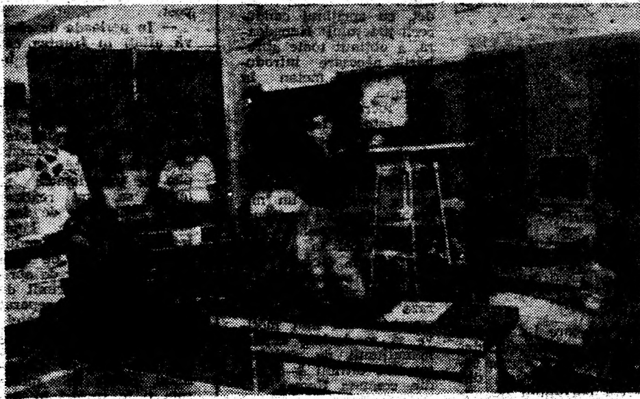
Complexul de documentare și informare școlară de la Liceul Teoretic „Traian” Deva.

N-a trecut prea multă vreme de când elevii ai școlilor din județul nostru se întorceau, anul trecut, de la fazele naționale ale olimpiadelor școlare cu rezultate ce recomandau școala hunedoreană, în general, ca una dintre școlile apreciate în țară. De altfel, asemenea performanțe nu sunt doar de anul trecut sau de acum doi ani, pentru că în județul nostru există deja o tradiție recunoscută în ce privește valoarea și calitatea învățământului ce se desfășoară aici. Cu toate neajunsurile și dificultățile care, mai cu seamă în ultima vreme, își lasă amprenta asupra întregului sistem de învățământ, ace-