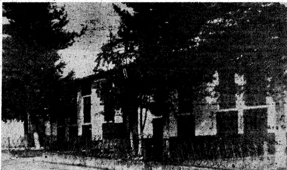
Căminul cultural din Certeju de Sus a fost renovat recent, prin grija Primăriei.