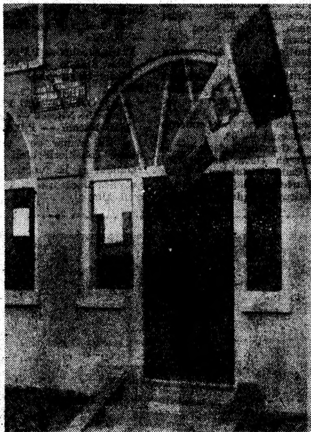
Totești. Sediul primăriei și consiliului local.