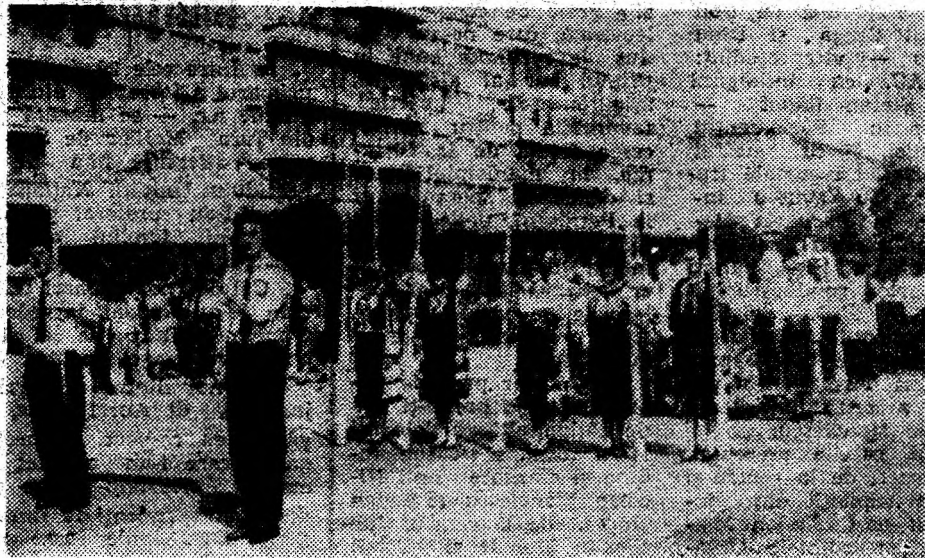
Festivalul muzical-artistic „Sabin Drăgoi” din Deva s-a deschis cu o paradă a formațiilor participante.