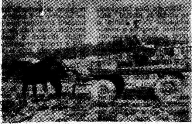
Se recoltează și se transportă varză de la ferma nr. 6 Simeria a S.C. Sansere Sinfandrei.

RUBRICA REALIZATA CU SPRIJINUL I.L.P. HUNEDOARA-DEVA