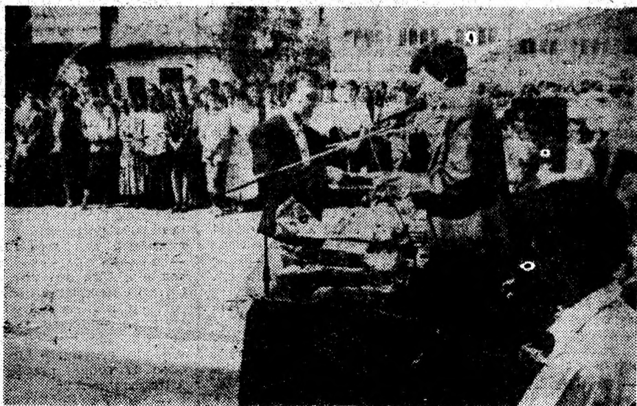
Moment emoționant la Grupul Școlar de Transport și Telecomunicații „Transilvania” Deva: primirea celor mai merituoși elevi.

BABIA , zeița tinereții, este adorată în Siria. Încearcă să-i spui așa unei tinere de la noi și... vezi tu!