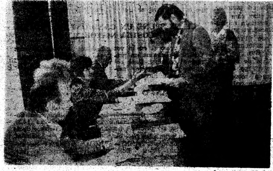
La Casa de cultură din Petroșani.