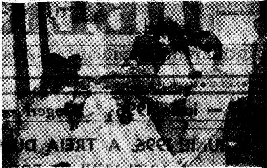
La Secția 34 Deva un vot, cu speranță pentru un oraș mai frumos.

ca cei 23 de alegători care votaseră până la ora 9,15 erau dintre cei ce și exercitaseră acest drept și la turul I.