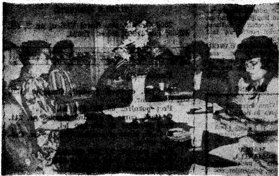
La Călan se votează a II-a oară.