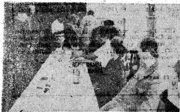
Se votează la Vulcan

meie — ce tocmai ieșise din secția de votare. Doamna ne-a spus: