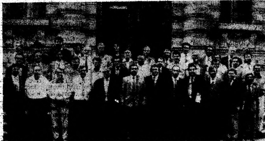
O fotografie de album. Consiliul județean în plenul său, imediat după constituire.

Din delegația permanentă fac parte, de drept, președintele și vicepreședintele aleși ai Consiliului județean.