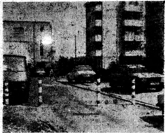
Deva — Aleea Crizantemelor, o stradă oprită după placul unora!