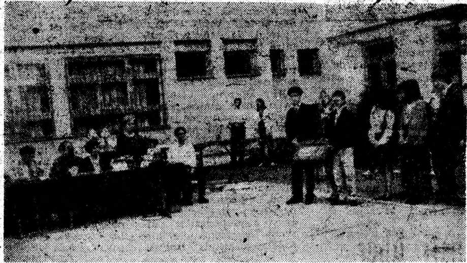
La Grupul Școlar de Transport și Telecomunicații Deva, absolvenții clasei a XII-a au predat cheia colegilor din generația următoare. Le dorim să descopere „cheia succesului” în viață, iar până atunci bătă la examene!