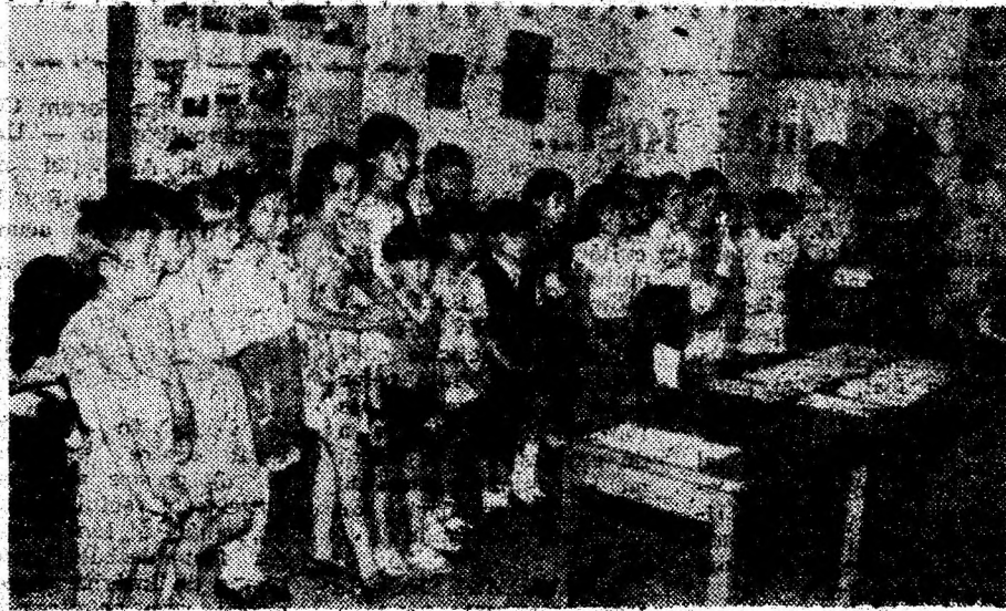
Micii arheologi deveni în timpul ceremoniei de premiere.