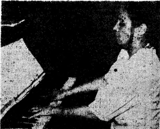
Muzica e viața mea.

— capacitățile și talentele copiilor nu trebuie nici supraevaluate nici subestimate; — să le dăm sfaturi fără a-i obliga să le urmeze; — încredere trebuie să le acordăm chiar dacă ne-au dezamăgit; să le dăm o a doua șansă; — să nu-i obligăm să trăiască doar după „rețetele” noastre; oricât de bogată ar fi experiența noastră de viață ea n-o poate înlocui pe a copilului; — copilul devine responsabil dacă i se dă mai multă libertate de decizie; — să tratăm copilul ca pe un egal, fără jigniri și dispreț, recunoscându-i și apreciindu-i părțile bune; dacă-l respectăm și el ne va respecta; — diferențele se rezolvă prin dialog, nu prin forță; ceea ce nu știe trebuie să-l învățăm cu blândețe și răbdare; — renunțați la cultivarea „pilelor” pentru copilul dv.; cultivați-i în schimb spiritul și mintea; — dându-vă de exemplu sau formulând judecăți de felul „Pe vremea mea...” s-ar putea să deveniți ridicolă în loc de a-i fi utilă; să nu uităm că ei vor trăi în mileniul trei și deci nu e cazul să-i pregătim pentru azi și cu atât mai puțin pentru ieri; secolul XXI va fi al informației, comunicării, tehnologiei înalte, renașterii religiei și artei; să ne ajutăm copiii să privească încrezători spre viitorul ce-i așteaptă.