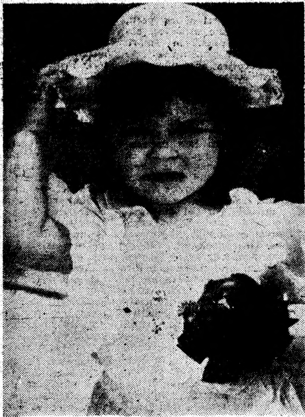
Un viitor fotomodel.