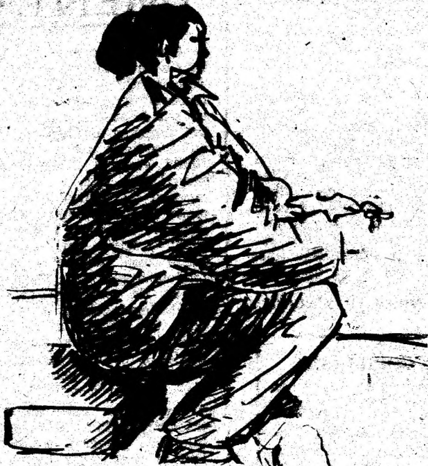
Desen de ANA MARIA PĂRĂU