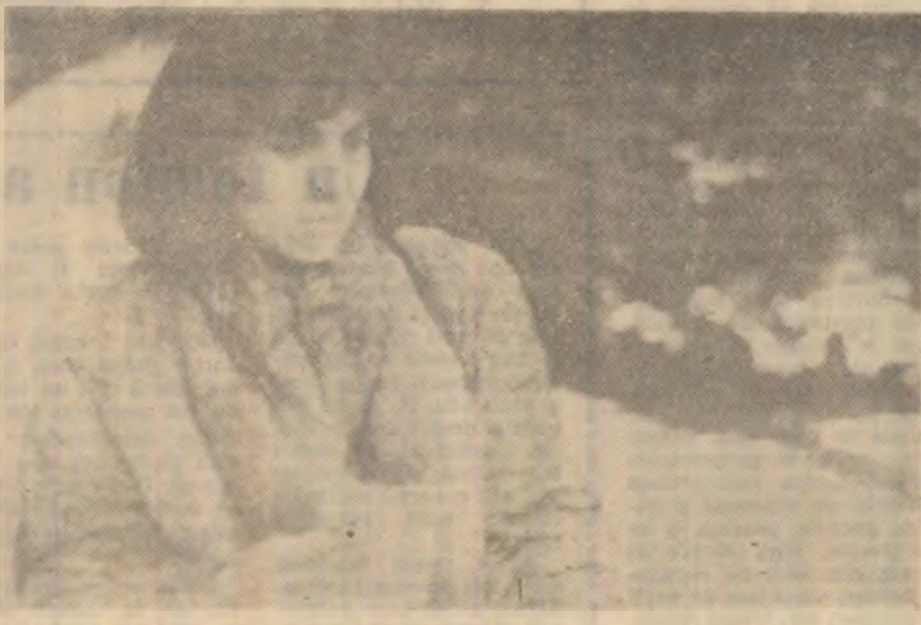
Spectacol pe scena Casei de cultură din Deva.

Moș Crăciun zăpădos prevestește an mănos. De va fi Crăciun ploios, vor fi Paștile friguroase. Această lună mai poartă numele de INDREA.