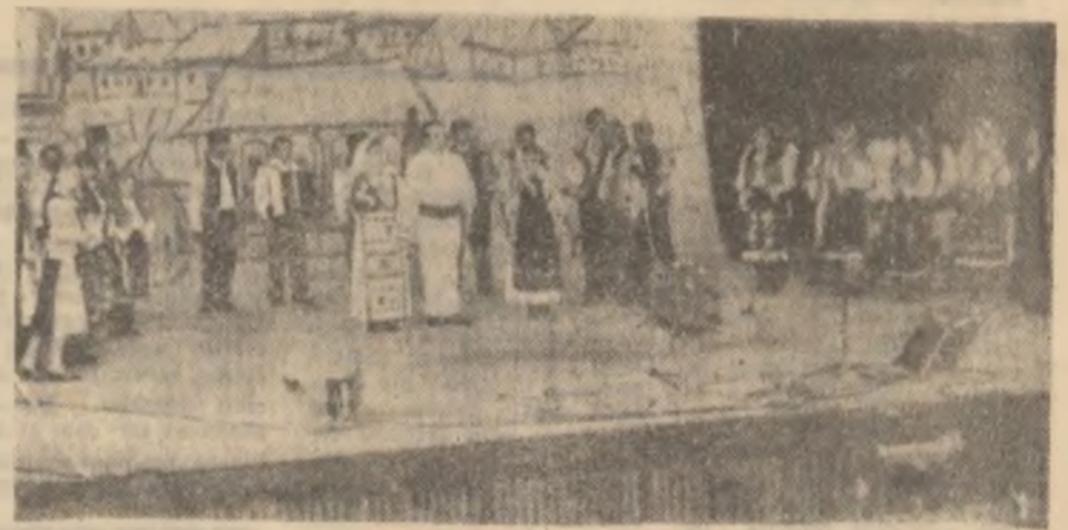
Și iarna-și are poezia ei.