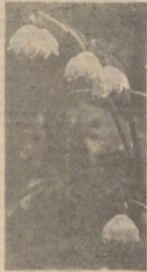
Boboteaza ne-a adus în loc de ger ghiocci.