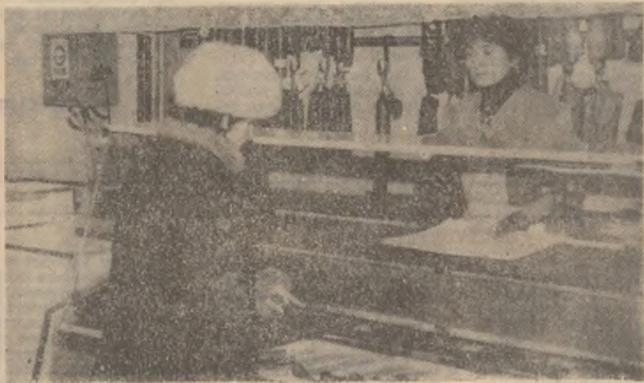
„Dați-mi 50 de grame de salam” — e solicitarea de ultimă oră din mezelării.