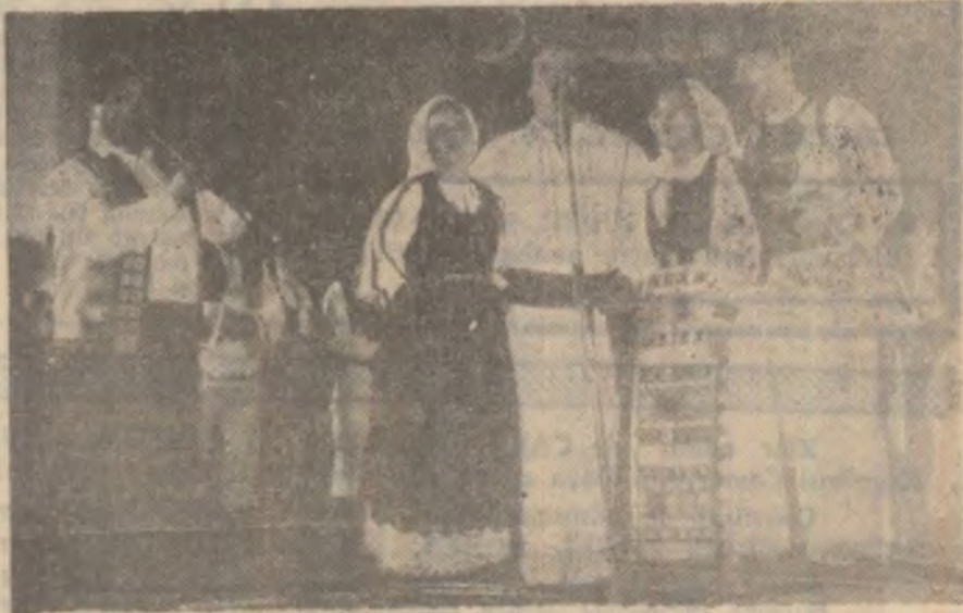
Mesageri ai cântecului și jocului popular românesc la Novo Selo (Iugoslavin).

Cursuri de referință ale Băncii Naționale a României.