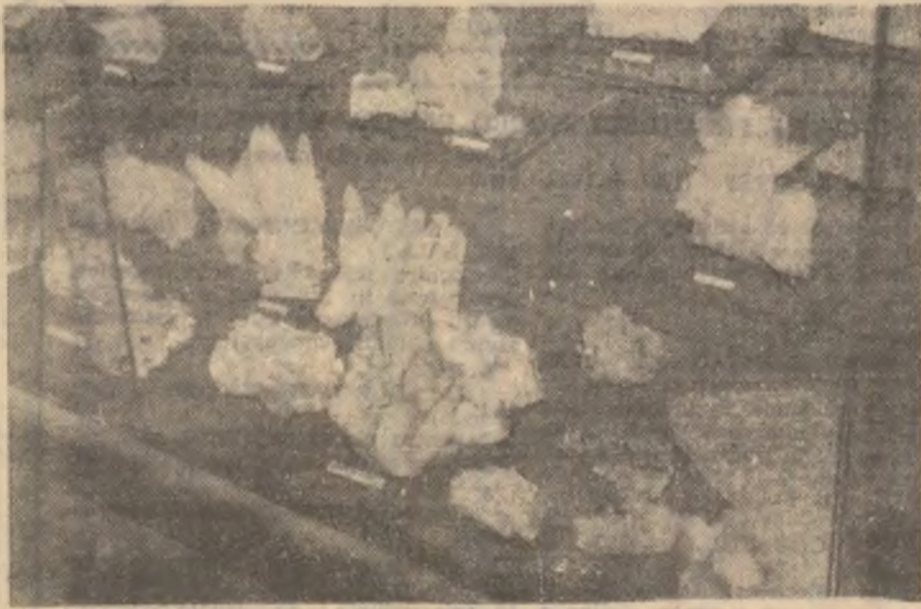
Aspect din Muzeul aurului din Brad.

avutului privat (din unități comerciale și locuințe), diferite acte de violență (V.N.)