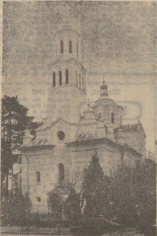
DEVA — Catedrala Sf. Nicolae, după renovare.