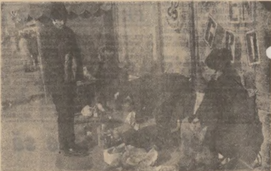
Cam de astfel de comerț stradal este vorba (II).

inițiali cât și buna colaborare cu reprezentanții OCOT-ului Deva care, de fiecare dată când au fost solicitați la cazurile litigioase cu caracter deosebit, s-au implicat neîntârziat. Dar ce păcat că la sediul primăriei zac însă multe titluri de proprietate neridicate, deși oamenii au fost anunțați. (A.I.J.)