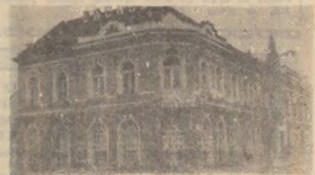
Despre marele Bachus.