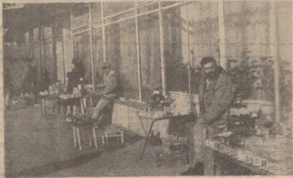
Cam de astfel de comerț stradal este vorba (1).