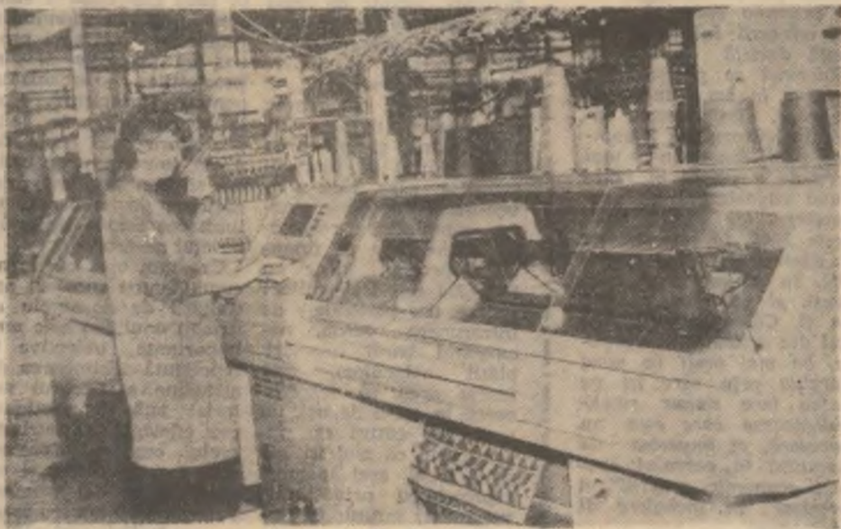
Noi mașini de tricotate la „Meropa” Hunedoara.