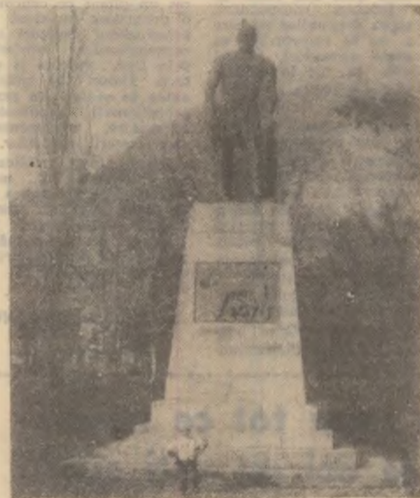
DEVA — statuia „Decebal” din parcul orașului.