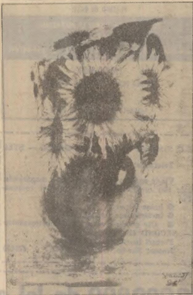
„Floarea soarelui” — Acuarelă semnată de Teo David, elev, clasa a X-a la Liceul „Avram Iancu” din Brad.