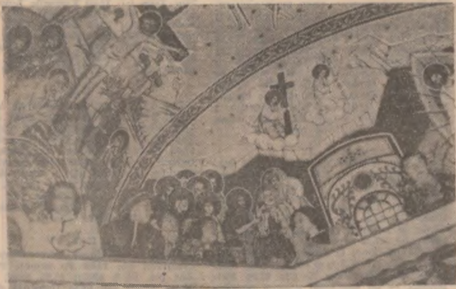
Locuitorii comunei Brănișca au reușit să renoveze biserica — tencuială cât și pictură — contribuția bănească a fost doar a sătenilor, fără alte ajutoare.

CRAVATA este un accesoriu al îmbrăcămii bărbătești, de obicei, constând dintr-o fâșie îngustă de stofă sau de mătase, care se înnoadă la gât și ale cărei capete sunt lăsate să atârne pe piept. Istoria acestui obiect, deci și a numelui său, își are originile în Croația. Soldații croați au fost aceia care au purtat pentru prima oară în jurul gâtului o fâșie agățată pentru a nu suferi de frig. Din această fâșie, cu timpul, s-a născut cravata, care astăzi are rol doar ornamental. Cei care au introdus acest obicei au fost soldații croați aflați în serviciul lui Louis al XIV-lea și care făceau parte din regimentul Royale-Cravate. Erau mercenari veniți în Franța către sfârșitul secolului al XVII-lea pentru a-l ajuta pe Regele Soare în războaiele din Olanda și în cele de succesiune