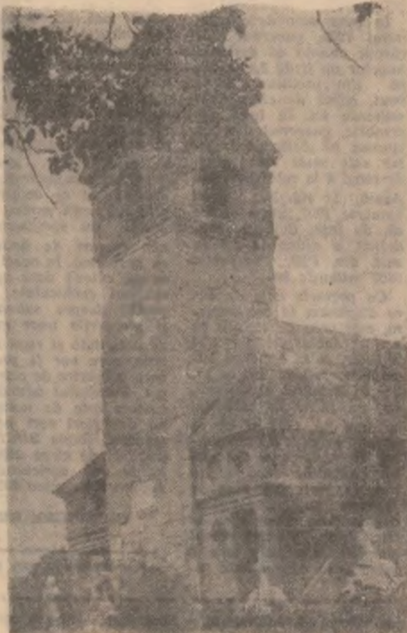
Biserica Ortodoxă Peșteana.

Contul Bisericii ortodoxe Peșteana: Bankcoop — filiala Hateg, cont nr. 402400346427.