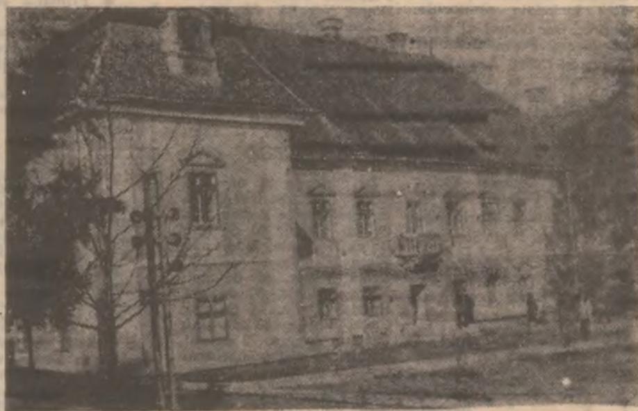
Deva, Muzeul Civilizației Dacice și Romane.

Surpriza a constituit-o însă pliculețul trimis pe adresa redacției noastre. Cântărea doar 1,25 grame.