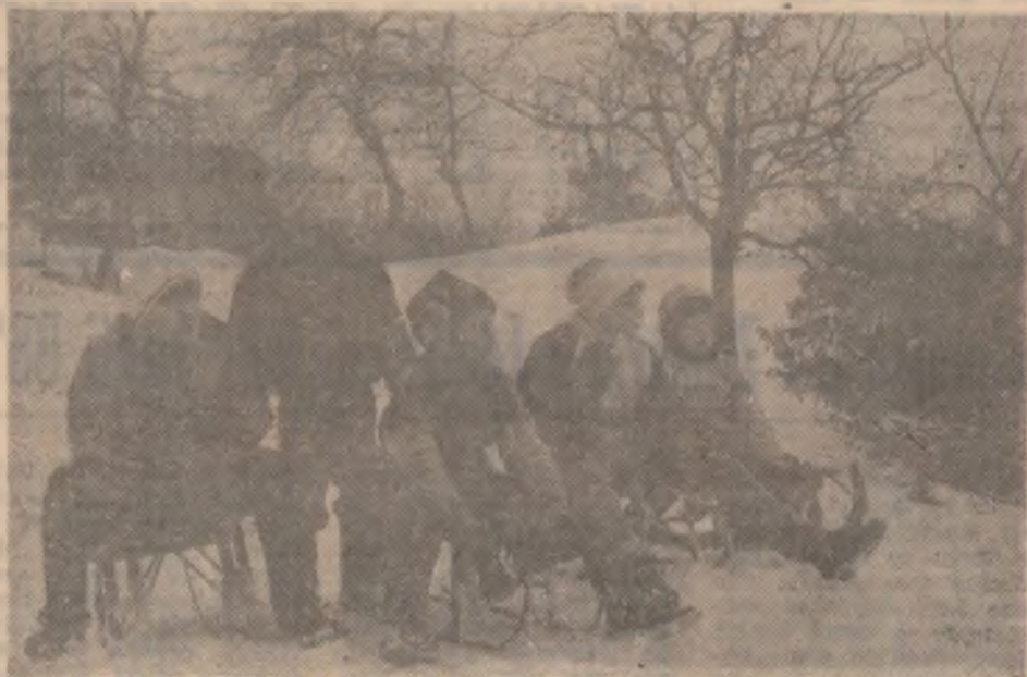
Unde sunt zăpezile de altădată? Credem că nu prea departe. Să nu uităm că februarie nu a trecut!