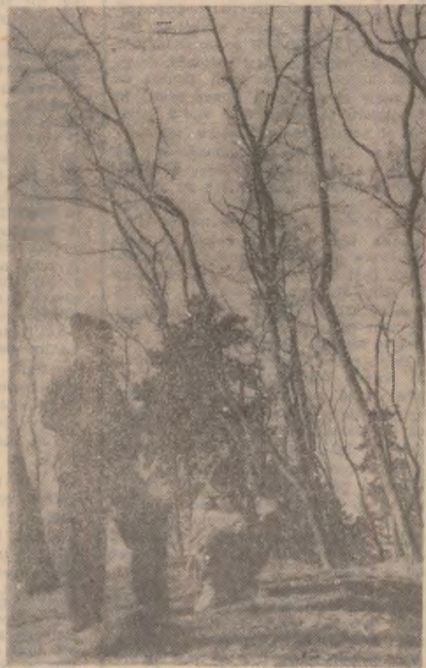
O zi de primăvară?!

Ploile abundente din luna decembrie 1996 au declanșat alunecarea terenului făcând imposibilă aprovizionarea cu lemne de foc și alimente a celor peste 25 de gospodării blo-