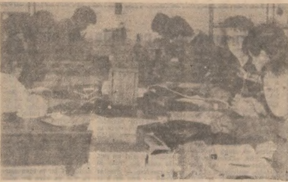
Electroniștii în acțiune. Aspect de la faza județeană a concursului de electronică.