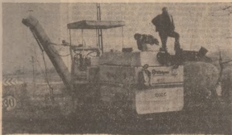
Pauză de alimentare cu combustibil.