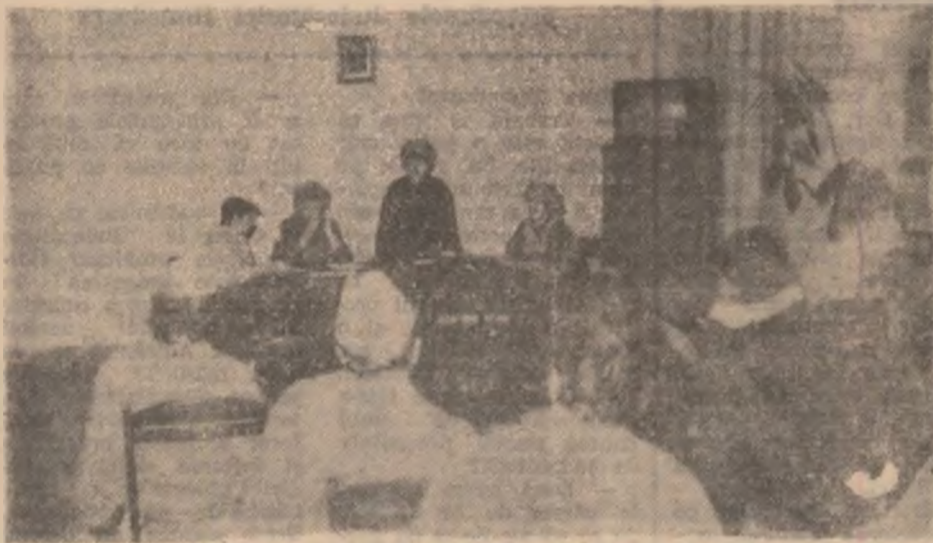
Aspect din timpul instruirii personalului medical.