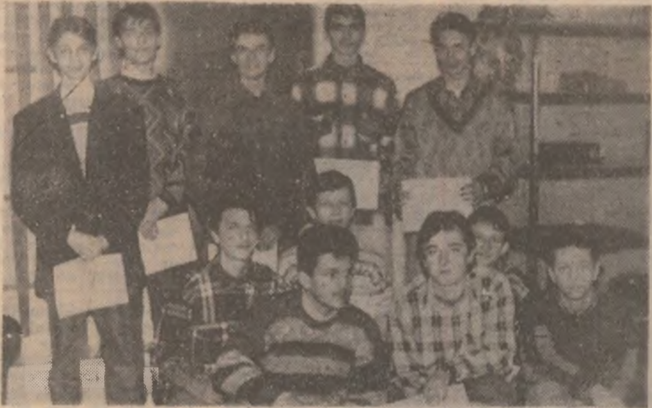
Premianții fazei județene a concursului de electronică, satisfăcuți de rezultatele obținute.