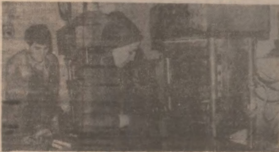
Tinerii prezentați în imagine au deprins bine meseria la piesele Pireli ale Cooperativei „Cauciucul” Deva, unde se fabrică articole din cauciuc, inclusiv pentru mașinile de spălat livrate de la Cugir.