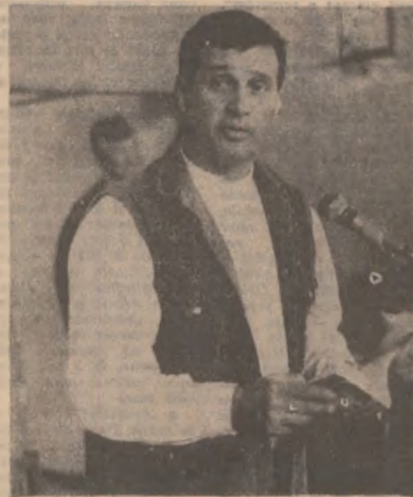
Mircea Dinescu la întâlnire cu elevii Grupului Școlar de Transporturi și Telecomunicații „Transilvania“ Deva, cu prilejul lansării volumelor „O beție cu Marx“ și „Pamflete vesele și triste“.