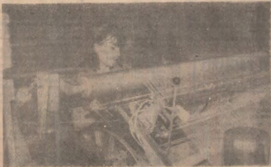
În industria ușoară lucrează mai ales femei. În imagine: o tânără, de la S.C. „Matex“ S.A., Deva, la un război de țesut.

N.R. Așteptăm și alte sugestii de la cititoarele noastre privind mai ales rețetele specifice postului mare și primăverii.