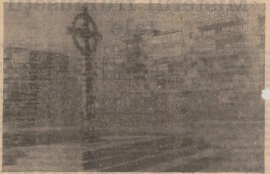
Deva — Monumentul Eroilor Revoluției (Parcul — Opera).

Întâmplarea a făcut să-mi cadă la vedere un document — mai bine zis o factură pe care am constatat (culmea!) nu mai puțin de 9 semnături și parafe până ce niște sortimente de cealuri au ajuns de la locul de producere la o unitate de comercializare. De aici se desprinde clar nota accentuată de birocratie, circuitul încâlcit al mărfurilor de la producători la beneficiari. Credem că aluzia va fi bine înțeleasă și, ca urmare, se va îmbunătăți regimul semnăturilor, iar drumul produselor spre consumatori va fi mai bine organizat. (N.T.)