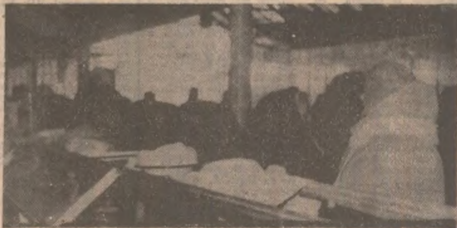
În piața cumpărătorii vin, văd, întrebă și... pleacă.