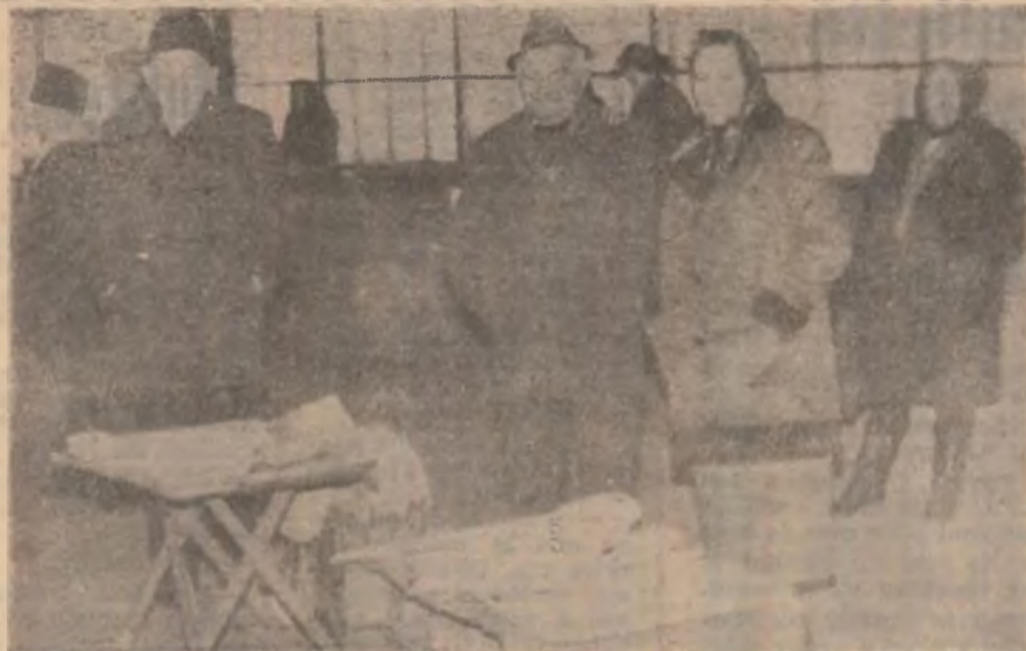
Oferta de linguri de lemn în piața Devei este, după cum se vede, destul de bună. Întrebarea ce se pune este însă: ce se mai poate mânca cu ele?

de casă. Prințând gustul acestei indelețniciri, care acoperă în bună măsură cerințele de carne în familie, în comună există acum, în crescătorii, peste 1200 de iepuri de casă. (N.T.)