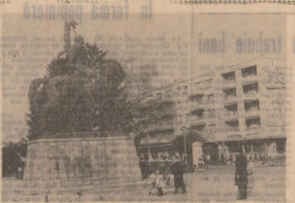
Deva. Statuia „Decebal”.