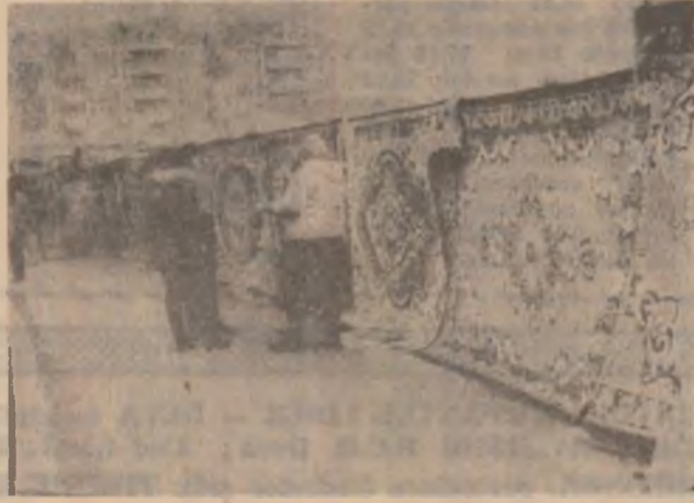
În aceeași piață, majoritatea produselor sunt aduse din Turcia — covoare, blugi, pantofi, haine de tot felul, dar la prețuri echivalente cu salariul mediu. În imagine — gardul pieței împodobit cu covoare din Turcia.