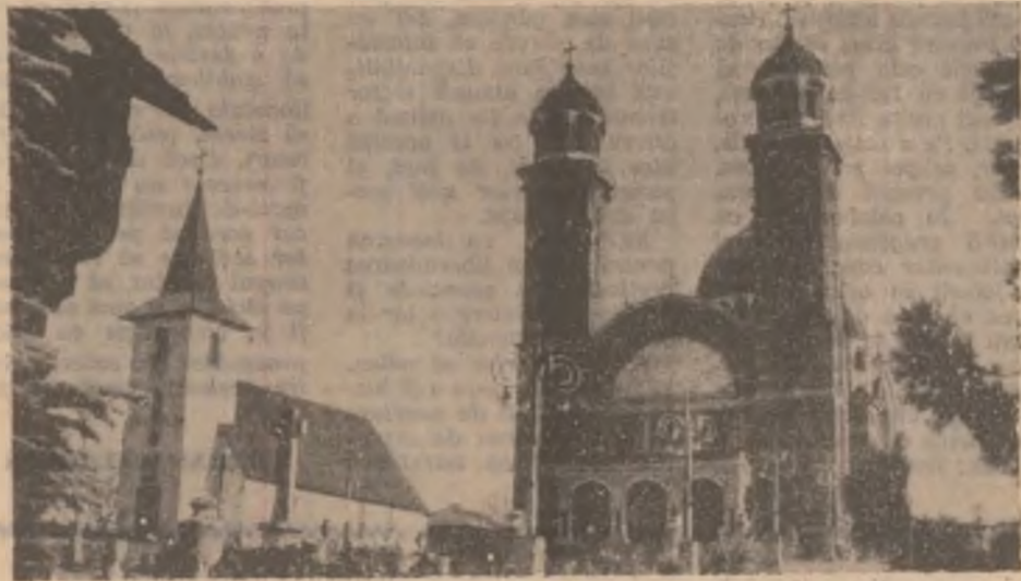
Stau alături vechea biserică și impunătoarea Catedrală Ortodoxă din Ghelar, ca o dovadă a credinței neclintite a pădurenților în timp.

Păcat că, din cauza exploatarea muncii de fier din subteran, catedrala prezintă fisuri iar lipsa banilor pentru remedierea stării actuale face ca asupra sa să planeze pericolul surpării.