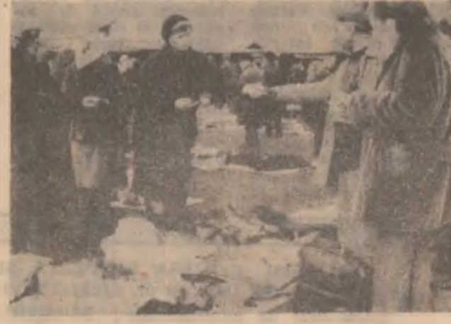
Omul nevoiaș, ca să mai supraviețuiască încă o perioadă grea, vinde lucrurile din casă altor persoane ce mai au încă câțiva bănuți, dar la fel de multe nevoi.