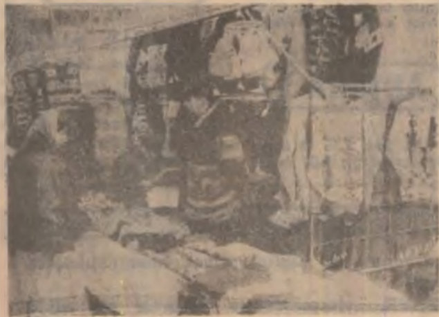
DEVA, piața din Micro 15. O singură firmă din județ — TRICONA PRODES S.A. SIMERIA desfăcă produse confecționate din lână, cu materia primă procurată din țară. Prețurile produselor sunt acceptabile și de calitate deosebită.