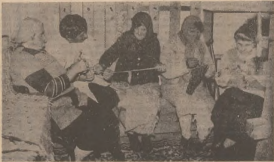
Căminul de Bătrâni Brad. În atelierul de țesut doamnele, care trăiesc aici, fac terapie ocupațională.

Nu, stimate cititoare, titlul n-are nici un fel de legătură cu doamnele de vârstă a treia. Și nici măcar cu Babele din Bucegi. Se referă de fapt la pri-