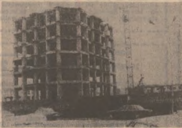
Încet, încet, palatul administrativ de pe bulevardul Decebal din Deva prinde contur.