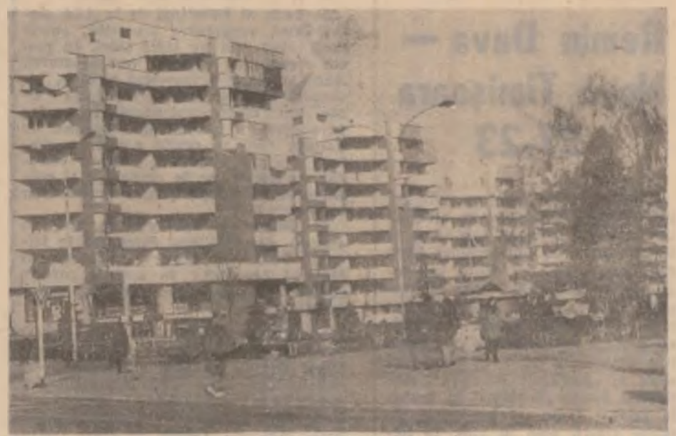
Vedere din Deva.