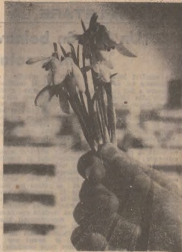
Ghiocelii — cel mai frumos dar al primăverii.