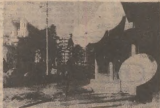
DEVASAI — sfere de lumină și culoare.