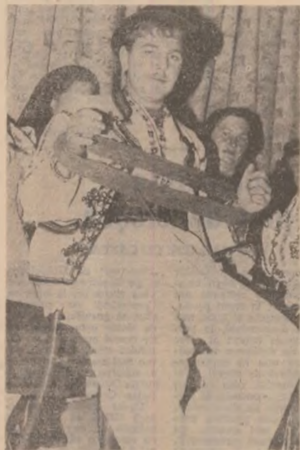
După bugetul ficcării, pentru prietene și iubite, băieții pregătesc cadouri de 8 Martie...

— A, nu știam. Acea care are un frate la Buzău!