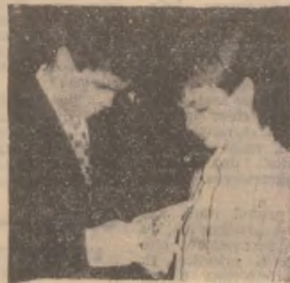
Marele campion dă autografe

După victoria de răsunet în istoria boxului profesionist a hunedoreanului MIHAI LEU, încununat cu titlul de campion mondial la categoria semimijlocie în ziua de 22 februarie a.c., a urmat o primire deosebit de caldă în Capitală, dar și acasă, în județul Hunedoara.