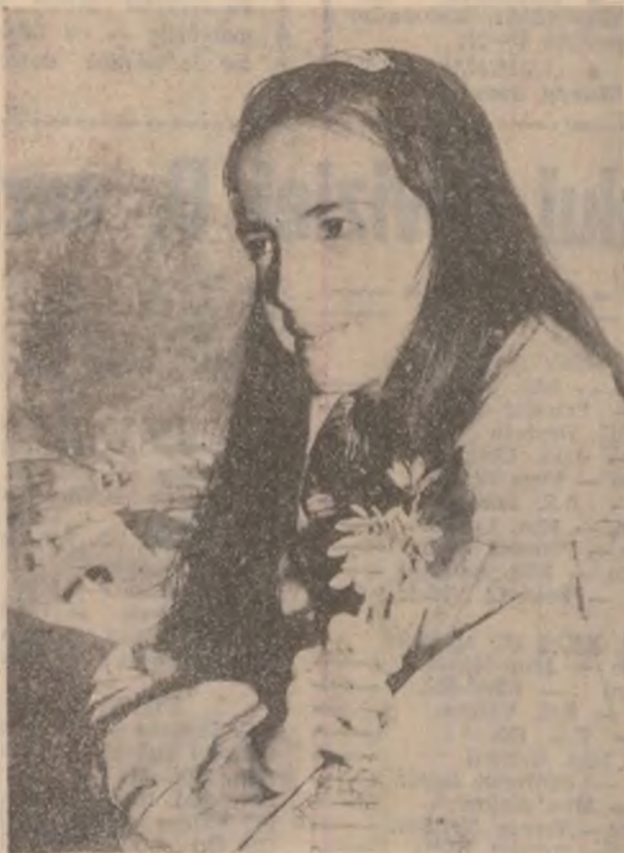
Zâmbet și ghiocel de ZIUA MAMEI.

DJUBRAN „Nimic nu este mai complicat ca viața unei femei care se află între un bărbat care o iubește și un bărbat pe care îl iubește“.