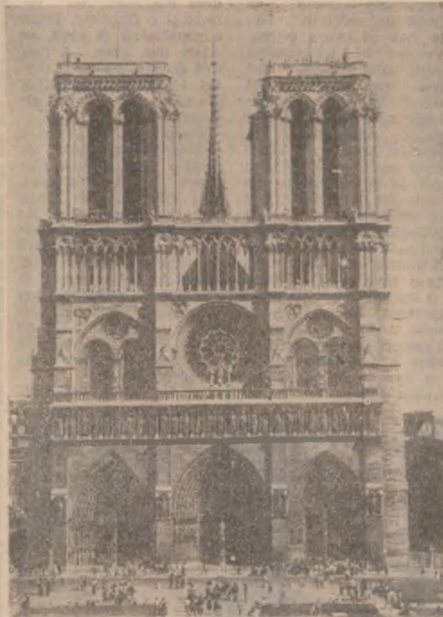
PARIS. Catedrala Notre-Dame.

Regele Solomon cel înțelept a vizitat într-o zi închisoarea locală interesându-se de faptele condamnaților: — De ce ești închis? — Întreabă pe unul dintre deținuți. Acesta se arunca la picioarele lui: — Prea luminate stăpâne, am fost acuzat că am furat în piață, de la un negustor. Dar sunt nevinovat. Judecătorul m-a condamnat pe nedrept! Solomon a trecut la alt deținut: — Tu de ce ai fost condamnat? — Prea luminate stăpâne, răspunse deținutul cu o voce tremurătoare, am fost acuzat de crimă, dar jur că am fost pedepsit pe degeaba. Sunt nevinovat. Și astfel i-au răspuns toți deținuții. În sfârșit a ajuns și la ultimul deținut, care stătea trist într-un colț al celei. — Bineînțeles că și tu ești nevinovat. — O, nu, prea luminate stăpâne, sunt un nemernic și un nelegiuit. Îmi merit pedeapsa. Judecătorul a fost chiar blând cu mine. Atunci, înțeleptul rege s-a întors către șeful închisorii și i-a poruncit: Scoateți-i lanțurile și puneți-l imediat în libertate, ca nu cumva să-i strice și pe ceilalți, pe nevinovați! (V.N.).