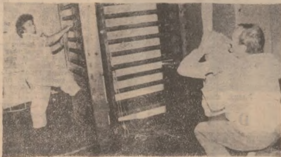
La Baia Sărată din Deva, în sala de gimnastică, sub îndrumarea prof. G. Purdea, are loc recuperarea fizică a pacienților.