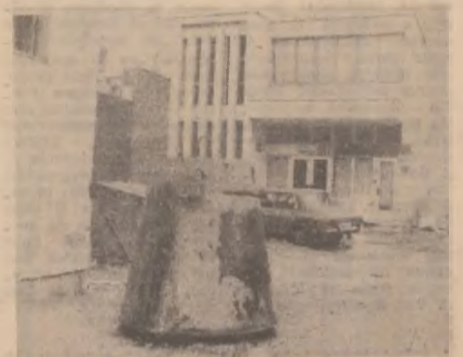
Complexul Comercial Kogălniceanu (Deva). Recipient cu sticle goale care nu se mai... golește.