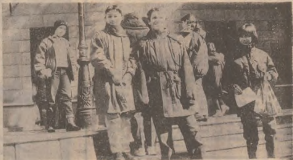
Colegiul Național „Decebal” Deva. Elevi ce au participat la olimpiada de matematică.

De remarcat că în perioada iunie '96, ianuarie 1997, la respectivul centru au fost internați 109 tineri cu recidivă, 95 la sută dintre ei fiind consumatori de heroină. (V.N.)