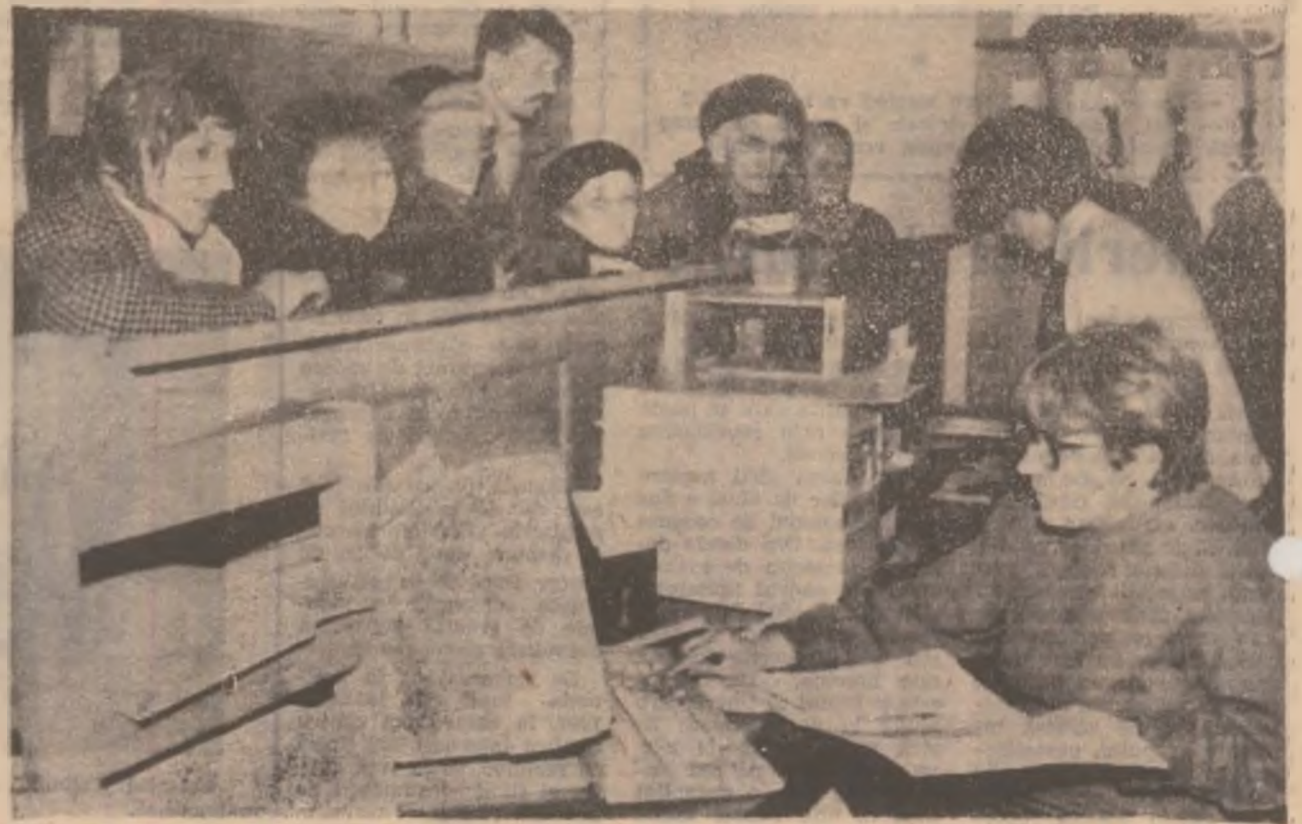
La biroul de relații cu publicul al Inspectoratului Teritorial de Stat pentru Handicapați Hunedoara — Deva zeci de persoane vin pentru a-și dobândi drepturile legale.