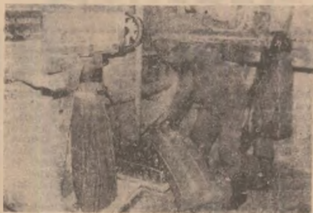
Moara veche a Devei.

Aspectele descentralizării pe care le are în vedere FIDEL ar putea fi interpretate drept o manifestare a dreptului constituțional al cetățenilor relativ la autonomia locală, inclusiv autonomia economică. În cadrul programului FIDEL vor fi cuprinse acțiuni pentru care se vor primi finanțări, după acceptarea proiectului de către un Comitet de Evaluare și Finanțare al Comisiei Europene, iar beneficiarul finanțării va fi consorțiul local care a făcut propunerea de finanțare. Pentru a face cunoscute condițiile și acțiunile care se finanțează, FIMAN desfășoară o campanie de promovare a programului PHARE — FIDEL în cadrul căruia vor fi organizate seminari de prezentare în fiecare județ al țării. În județul nostru acest seminar va avea loc la Deva, în data de 7 aprilie a.e.